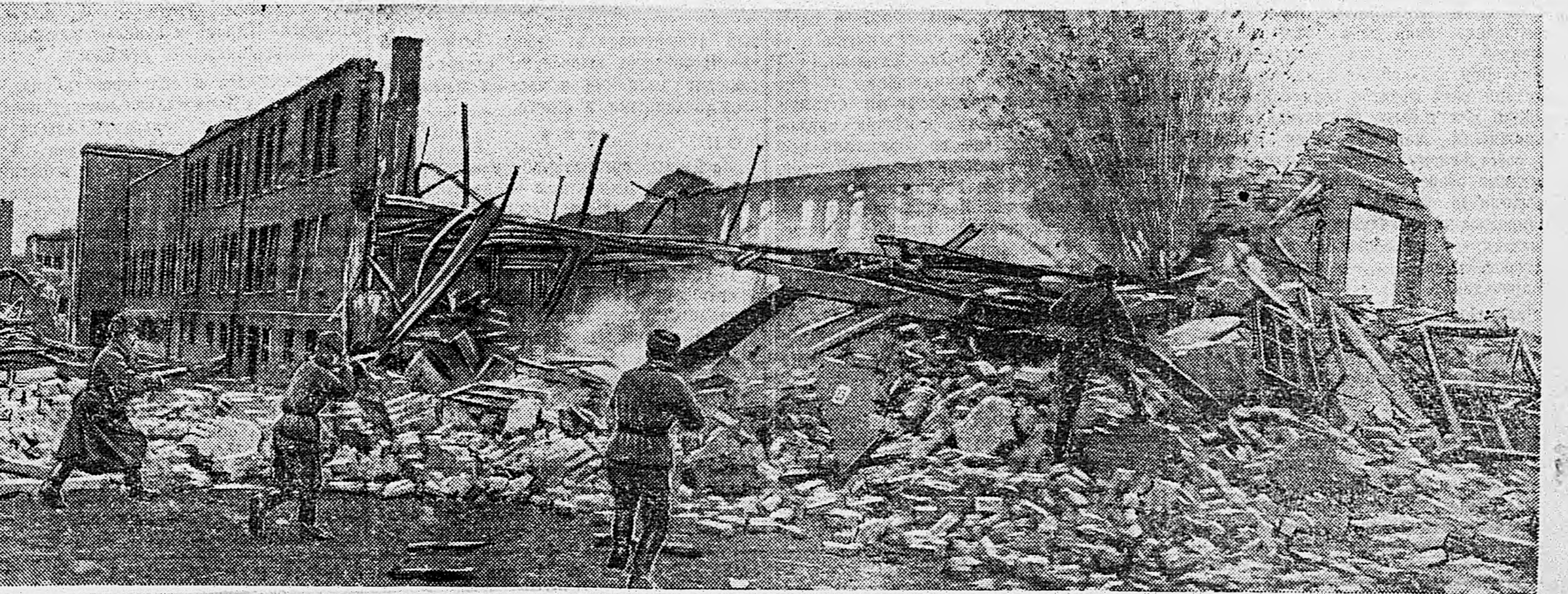
ГРУДЗЯНДЗ. Группа автоматчиков в уличном бою.