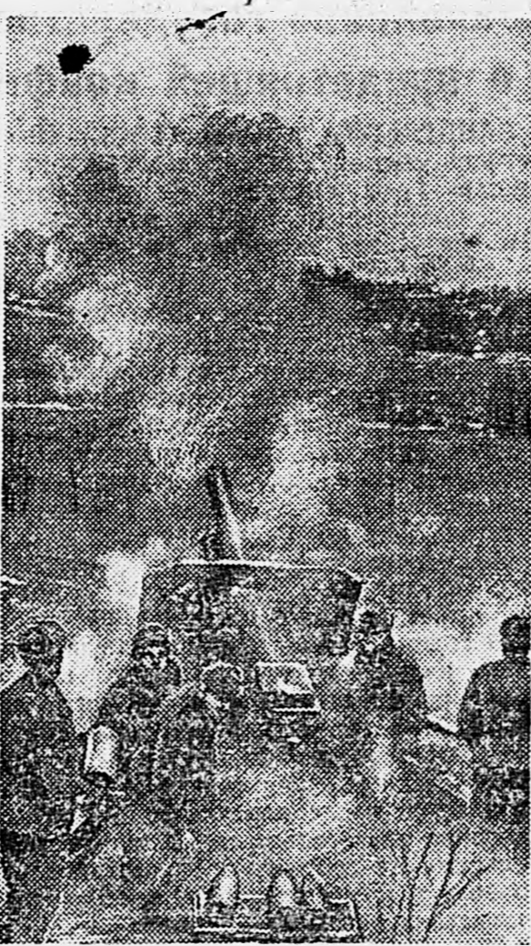
ГРУДЗЯНДЗ. Орудие ведет огонь по врагу.