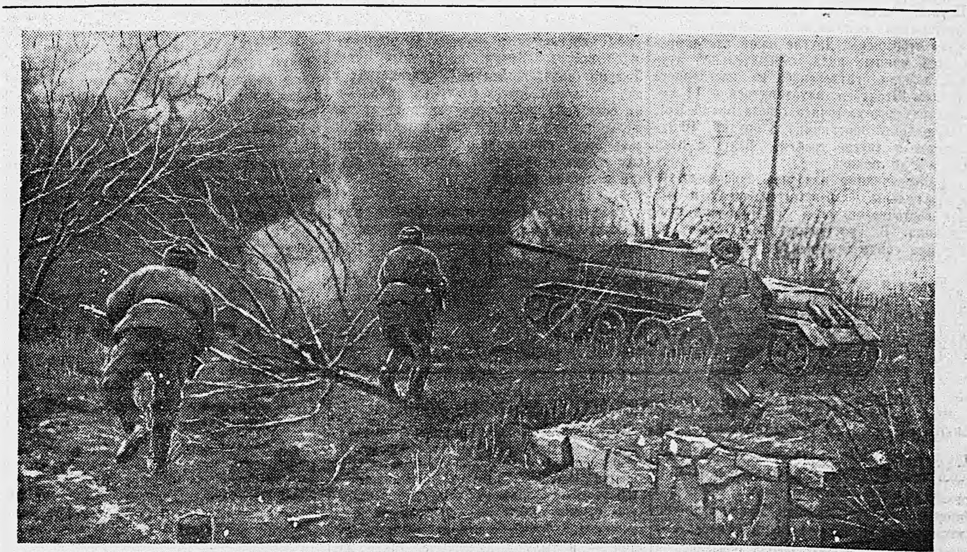
В ГЕРМАНИИ. Автоматчики под прикрытием огня артсамохода атакуют немецкие позиции. Сильное сопротивление.

3-й УКРАИНСКИЙ ФРОНТ, 5 марта. (По телеграфу от наш. корр.) Зенитчики подразделения капитана Саркисяна неустанно повышают свое мастерство. В перерывах между боями они изучают теорию стрельбы по пикирующим самолетам, тренируются в быстрой и точной наводке, изучают материальную часть. На днях батарея капитана Саркисяна провела удачный бой с самолетами противника. Был ярким осенний полдень. 12 вражеских истребителей, зайдя со стороны солнца, устремились на переправу, через которую двигалась колонна наших грузовых автомашин. Зенитчики немедленно открыли огонь. Первыми же очередями был сбит головной самолет противника. Огонь зенитов был настолько интенсивен и точен, что вскоре были биты еще четыре вражеских истребителя. Остальные самолеты противника повернули обратно. Пять сбитых самолетов за один день — таков итог одного боевого дня зенитчиков капитана Саркисяна.