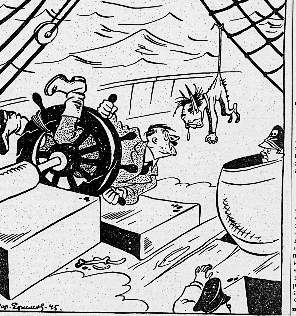
Не сводя глаз...

(Из последней статьи Геббельса в «Дас Райх»)