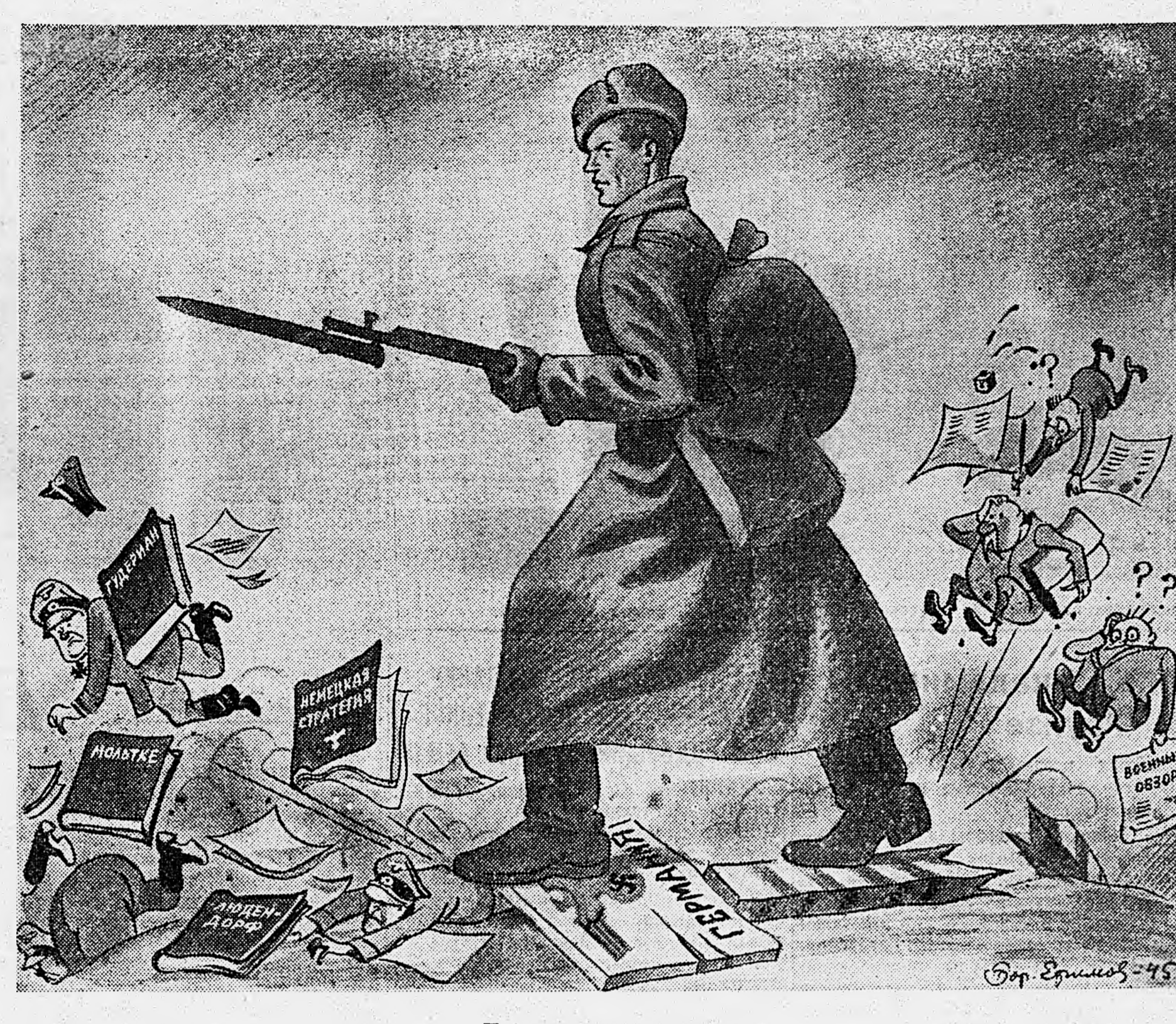
Рис. Бор. Ефимова.

ЛОНДОН, 21 февраля. (ТАСС). Агентство Рейтер передает сообщение итальянской газеты «Сюнес» о том, что швейцарские партизаны перехватили секретное сообщение, направленное Муссолини его «послом» в Берлине Филиппо Анфузо. Это сообщение проливает свет на положение в Берлине.