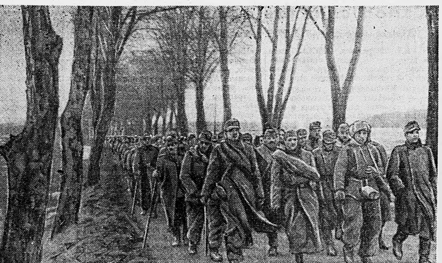
В ГЕРМАНИИ. 1. Пришла очередь немецких городов... 2. Прусского орда общипали. 3. Фрицы из «котла».