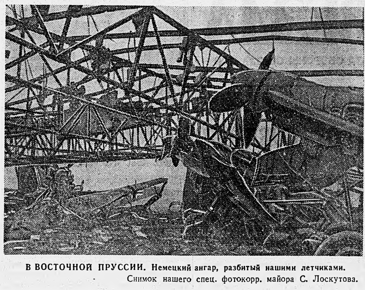
В ВОСТОЧНОЙ ПРУССИИ. Немецкий аэродром, разбитый нашими летчиками.

Подполковник Н. ПРОНОФЬЕВ. 3-й БЕЛОРУССКИЙ ФРОНТ. (По телеграфу).