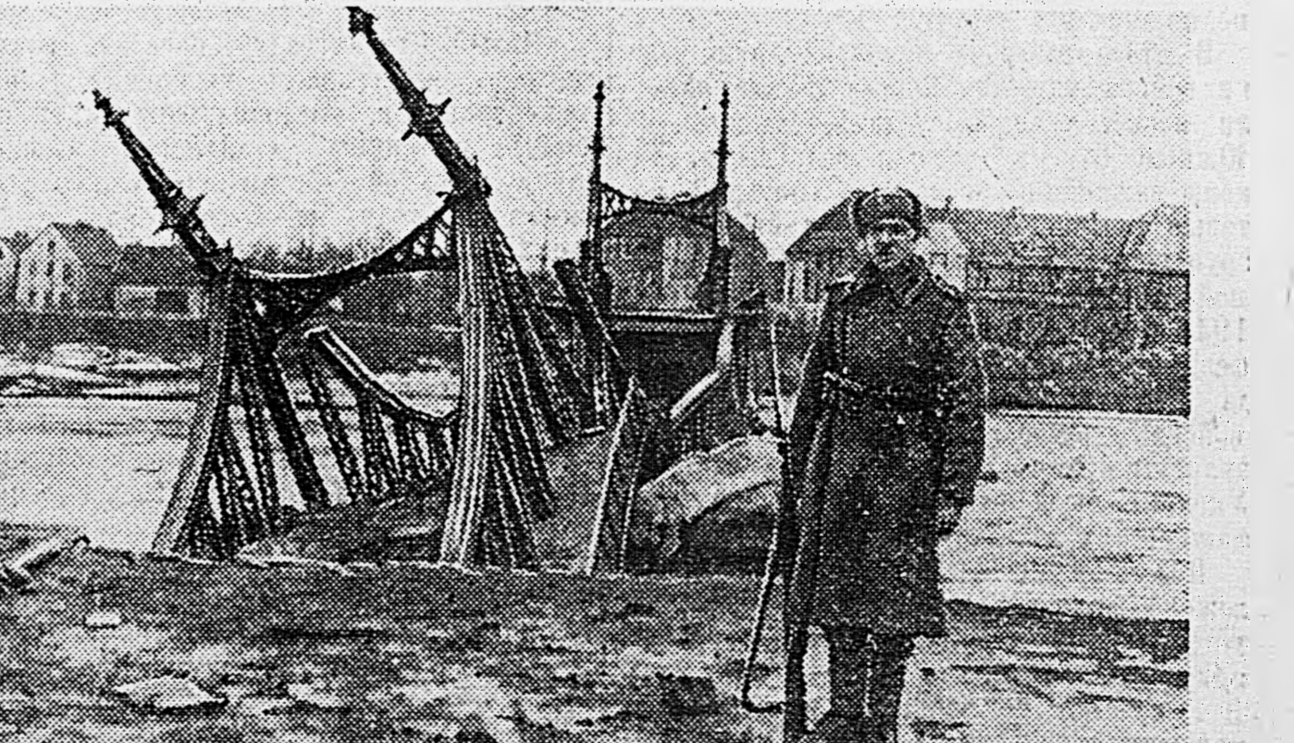
НА ОДЕРЕ. 1. Пристань в городе Олау. 2. Зенитчики подразделения капитана И. Люткова, сбившие 5 немецких самолетов, пытавшихся бомбить переправу. 3. Взорванный немцами мост.