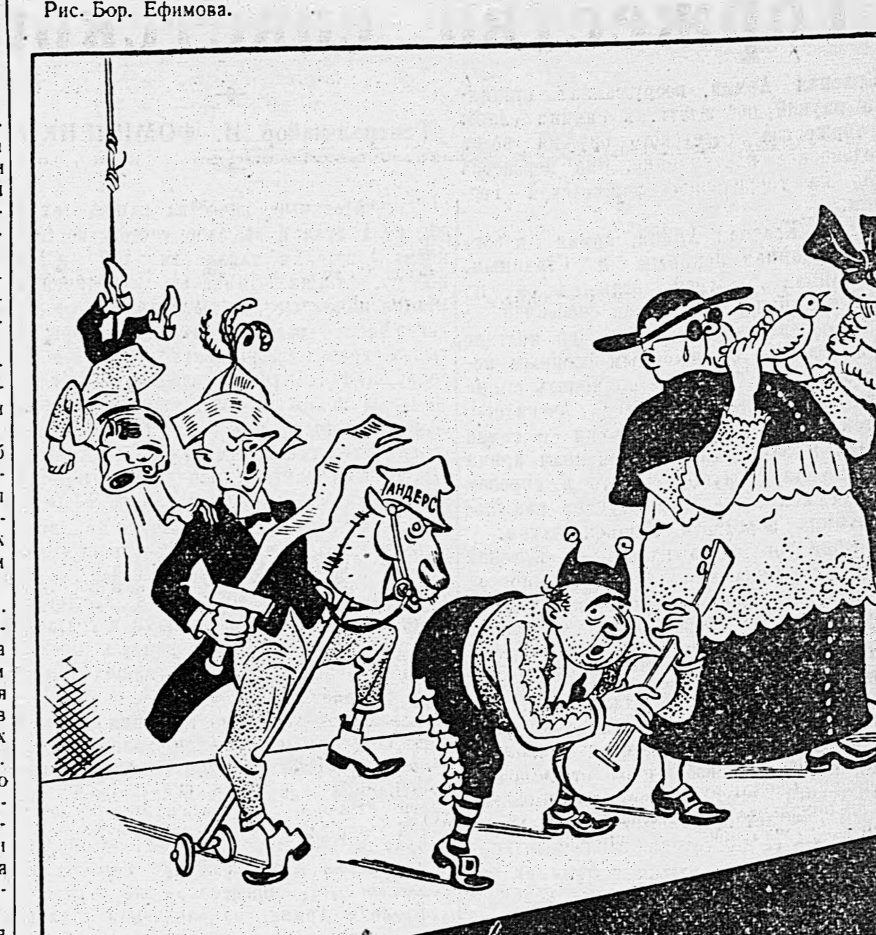
Эксцентричный геббельсово-вакано-испано-арцишевский ансамбль исполняет комический номер: «Мы недовольны Крымской конференцией».