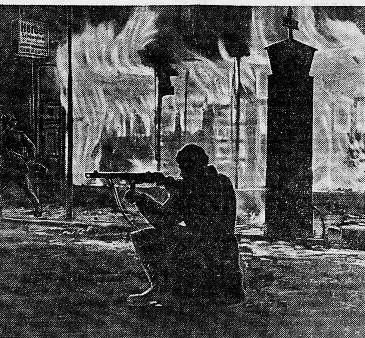
В НЕМЕЦКОЙ СИЛЕЗИИ. Советские автоматчики в ночном уличном бою.