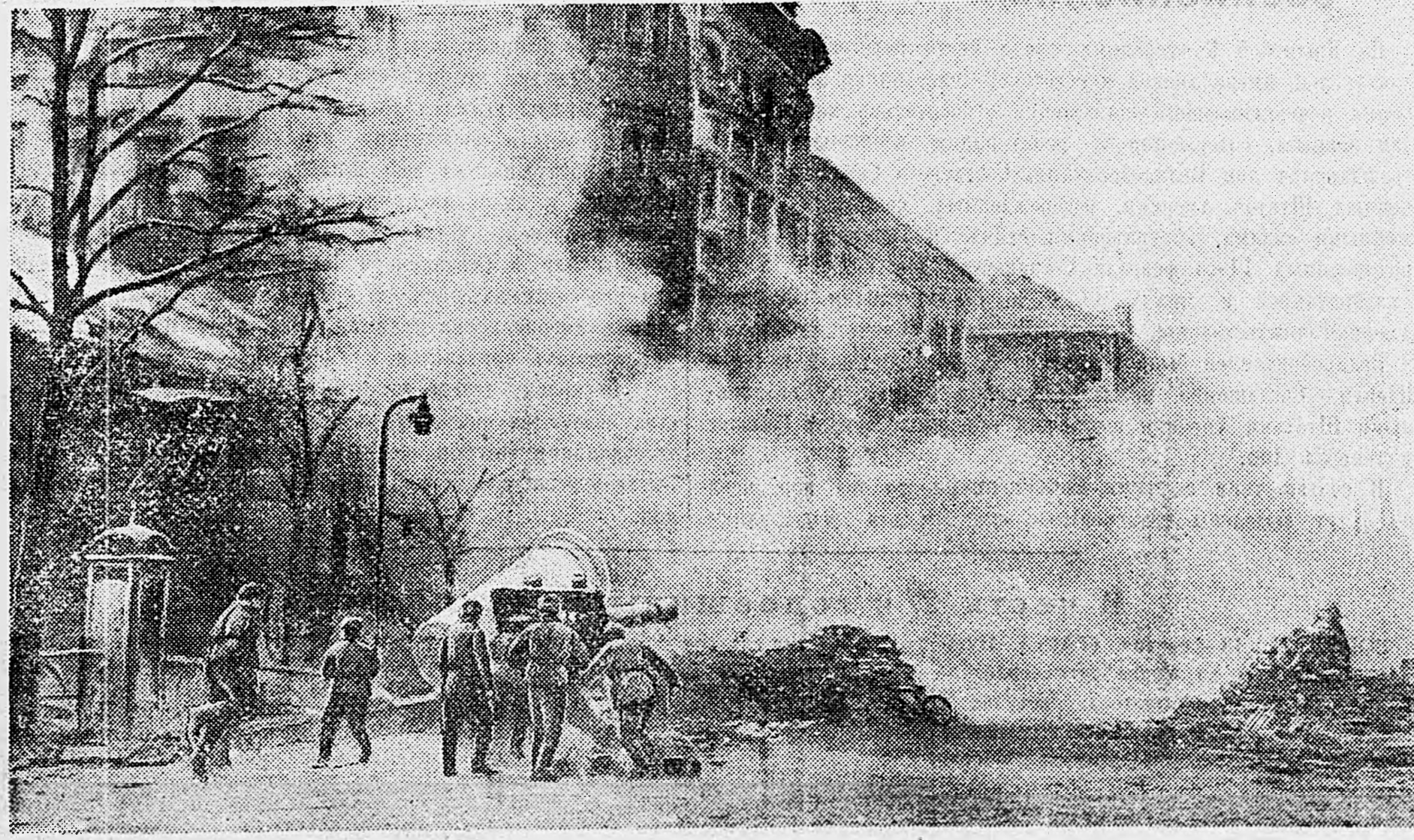
БУДАПЕШТ. 1. Последние бои в городе. Орудие ведет огонь по опорному пункту противника. 2. Наши войска проходят по улицам.

Слесарь Гришин сдержал слово и выполнил задание на 175 процентов. Все рабочие цеха перевыполнили обязательства и слали запас деталей для следующей смены.