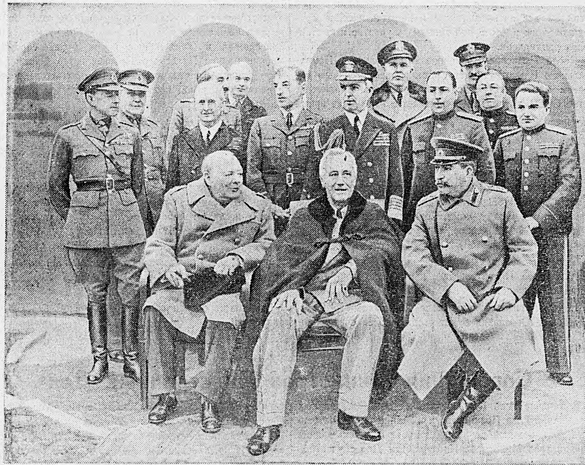
На конференции руководителей трех союзных держав — Советского Союза, Соединенных Штатов Америки и Великобритании в Крыму. На снимке: г-н У. Черчилль, г-н Ф. Д. Рузвельт и И. В. Сталин среди своих военных советников. Стоят слева направо: фельдмаршал Александер, фельдмаршал Вильсон, адмирал Кеннингхэм, фельдмаршал А. Брук, генерал Г. Измей, маршал авиации Ч. Портал, адмирал В. Леги, генерал Дж. Маршалл, генерал армии А. И. Антонов, генерал Л. Кутер, адмирал флота Н. Г. Кузнецов, маршал авиации С. А. Худяков.

Нашей непреклонной целью является уничтожение германского милитаризма и нацизма и создание гарантии в том, что Германия никогда больше не будет в состоянии нарушить мир всего мира.