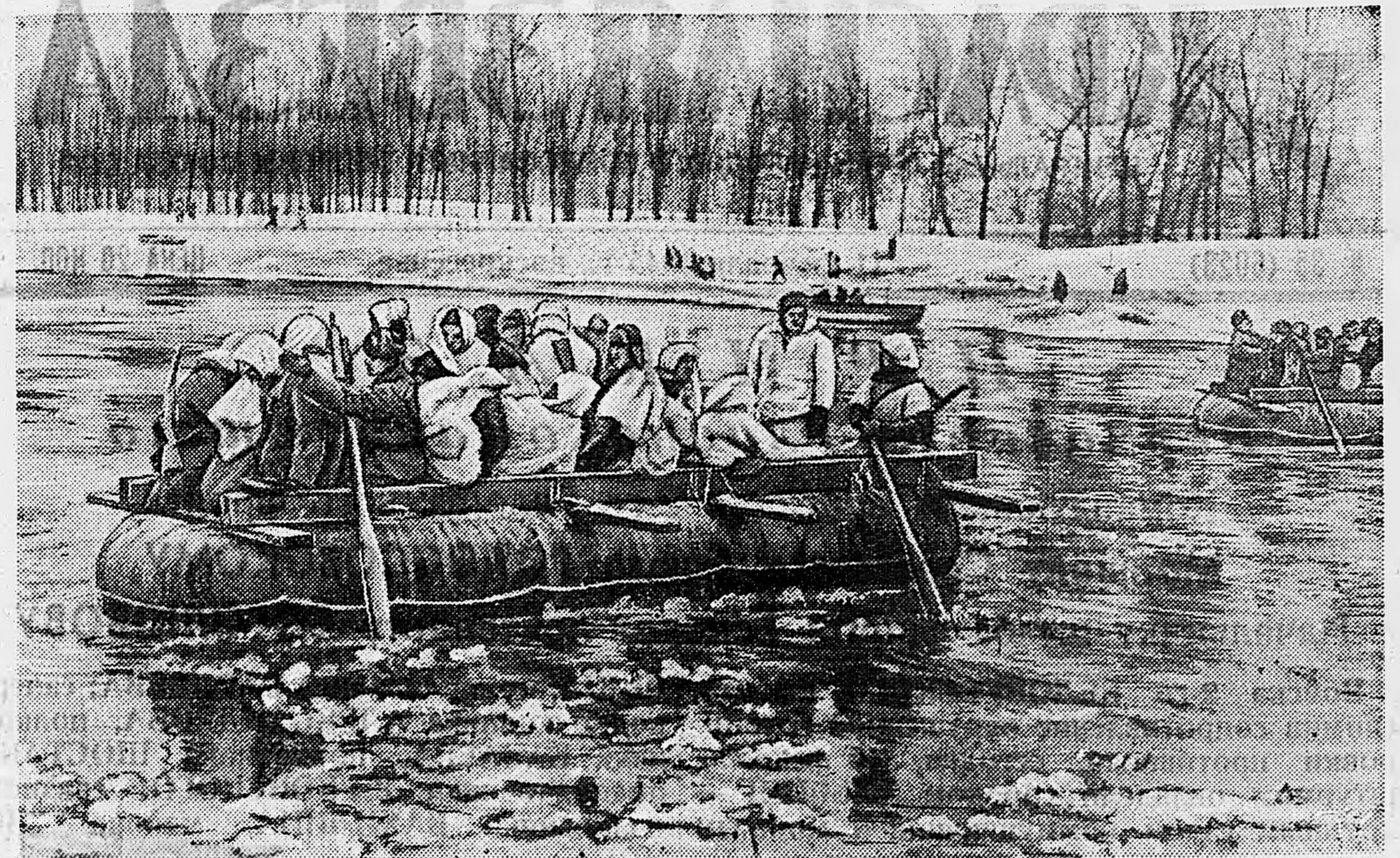
НА ОДЕРЕ. Стрелковое подразделение переправляется на левый берег.