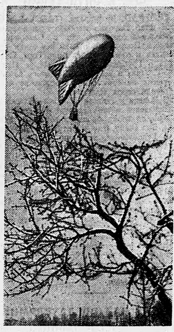
1-й БЕЛОРУССКИЙ ФРОНТ. Подъем аэроплана наблюдения.