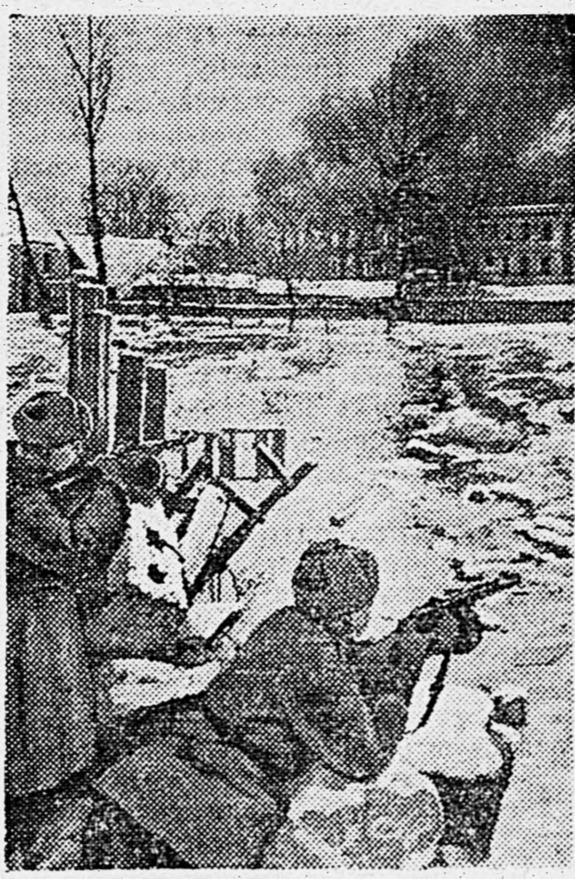
2-й БЕЛОРУССКИЙ ФРОНТ. Автоматчики выбивают немцев из населенного пункта.

Во втором вопросе стоял отчетный доклад партийной комиссии. Секретарь ее, майор Сергей, доложил о том, как росла и крепла парторганизация за отчетный период. В члены и кандидаты партии за это время приняты десятки лучших людей — инженеры, агрономы, врачи. При разборе заявлений в партию первичные организации проявили, как правило, строгий индивидуальный подход. Но были и промахи. Парторганизация несколько раз рассматривала заявления о приеме в партию без предварительного рассуждения на партийных собраниях первичных организаций. Были случаи, когда на механически утверждала неправильное решение первичных партийных органов.