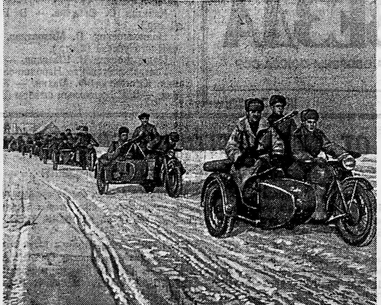
В ВОСТОЧНОЙ ПРУССИИ. Мотоциклетное подразделение на марше.

Когда к месту боя подошли другие машины, по рову лежали два разваленных немецких орудия, и рядом с ними стояли четвертьцать совершенно исправных. Ров и всё поле вокруг него были густо усеяны трупами немцев. Вот тогда и пошла слава про машину с цифрой 132 и ее водителя, отголоски которой прозвучали в рассказе автоматчика Прохоренко, встретившего на нем на фронтовой дороге. Подполковник Н. ШВАНКОВ. ДЕЙСТВУЮЩАЯ АРМИЯ.