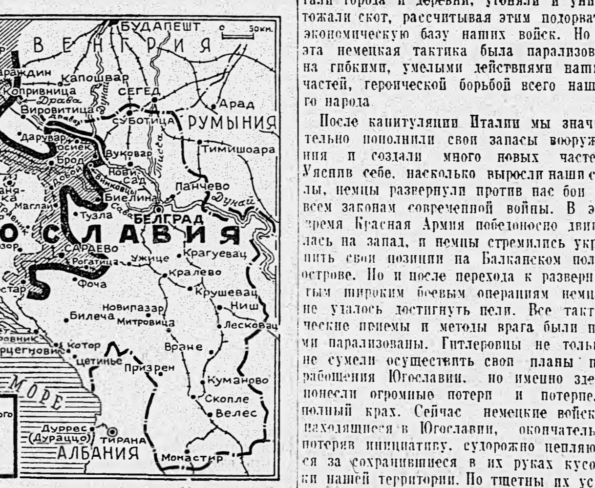
Линия стратегического фронта и территория дивизий и корпусов.

ность перейти к третьему этапу строительства армии. После белградской операции наши дивизии и корпуса были реорганизованы в армии, хорошо вооруженные, обладающие всем необходимым для ведения крупных операций современного типа. Освобождение Белграда наша армия осуществила непосредственную связь с Красной Армией и получила большую помощь в вооружении, что ускорило полное освобождение Македонии.