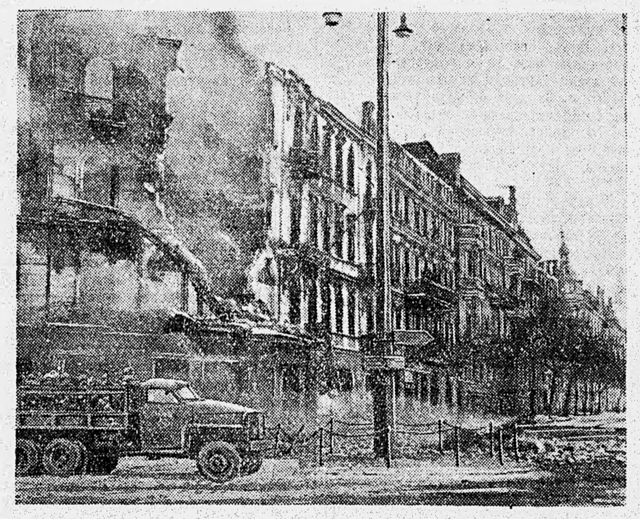
В НЕМЕЦКОЙ СИЛЕЗИИ. Одна из улиц города Опатовиц, занятых нашими войсками. Снимок нашего спец. фотокоор. капитана Г. Хомзора.

Танкисты захватили штаб немецкого саперного батальона вместе с находившимся там боевым знаменем.