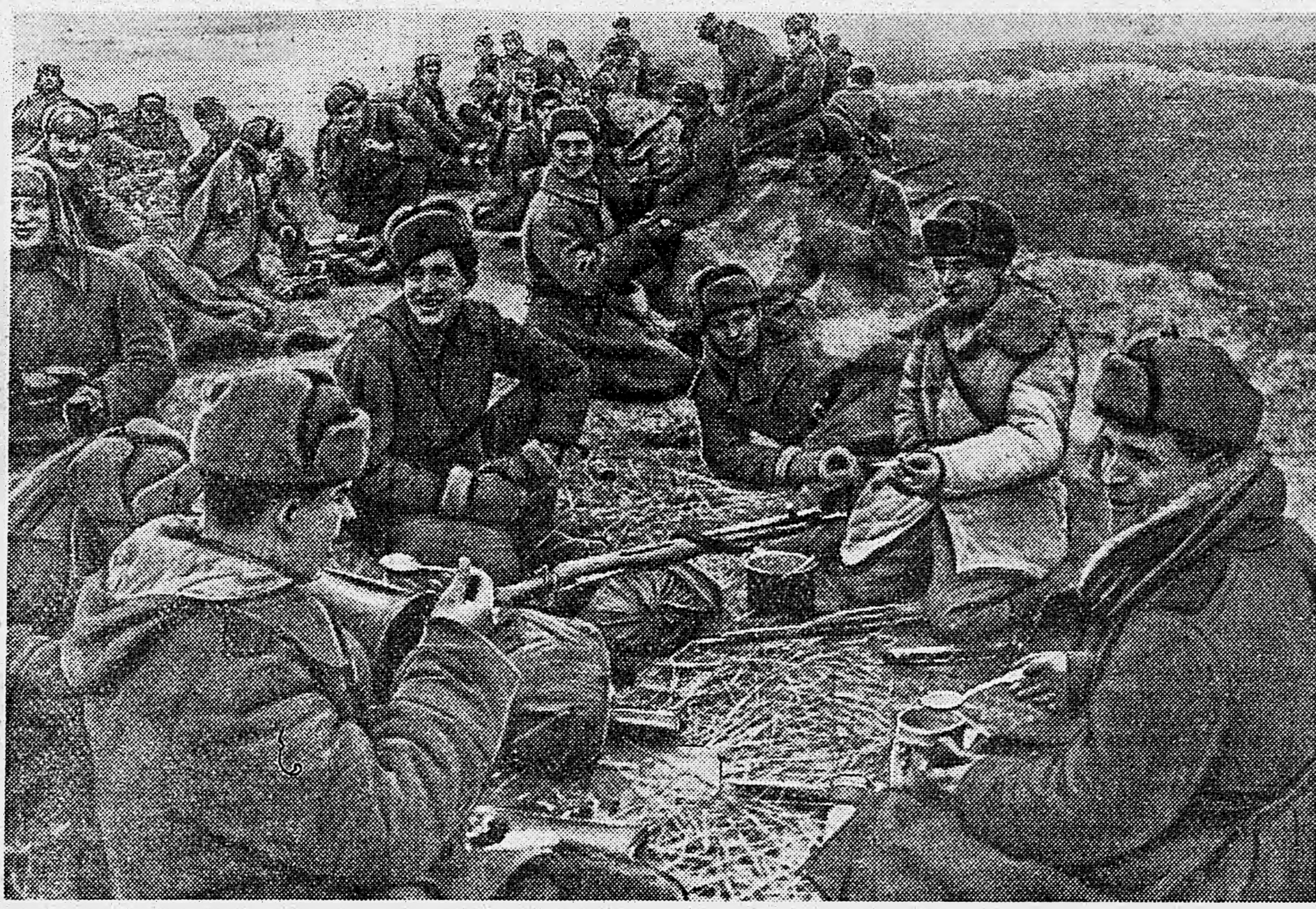
1-й БЕЛОРУССКИЙ ФРОНТ. На привале.

Многие сталинградские предприятия пришли к годовщине с превышением январского плана. На заводах и фабриках проведены собрания и беседы о великой Сталинградской битве в победе Красной Армии, полюбившей начало разгрома врага. С любовью и воодушевлением говорили участники этих собраний и бесед о товарище Сталине — организаторе разгрома немцев под Сталинградом.