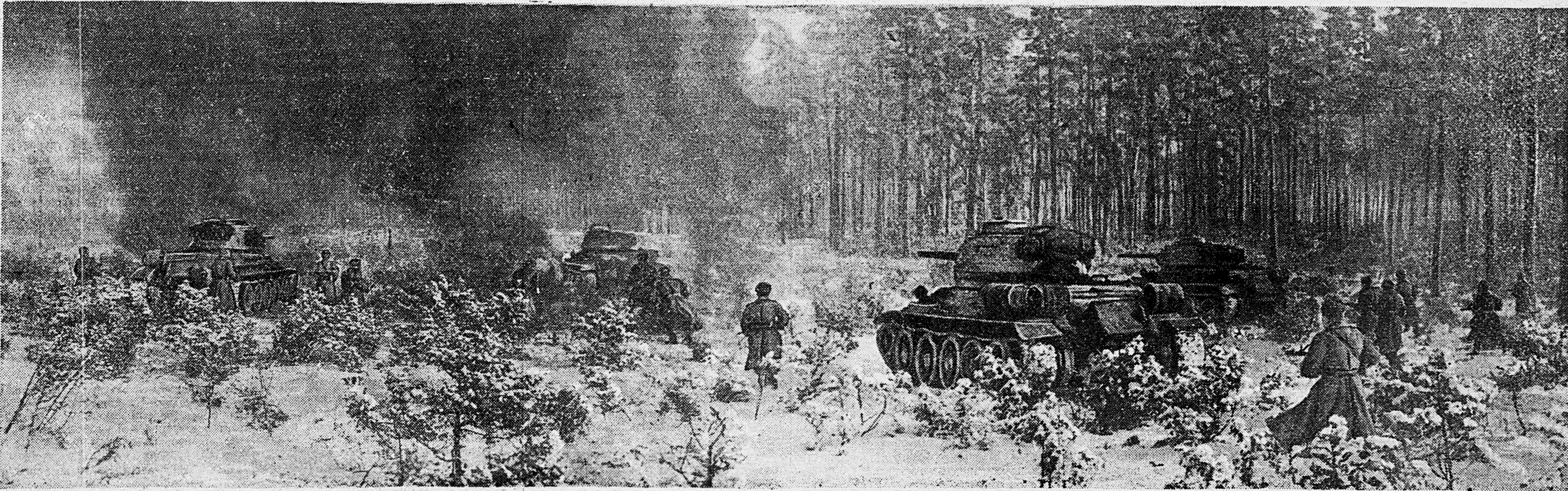
В ВОСТОЧНОЙ ПРУССИИ. Пехота при поддержке танков атакует узел сопротивления немцев.