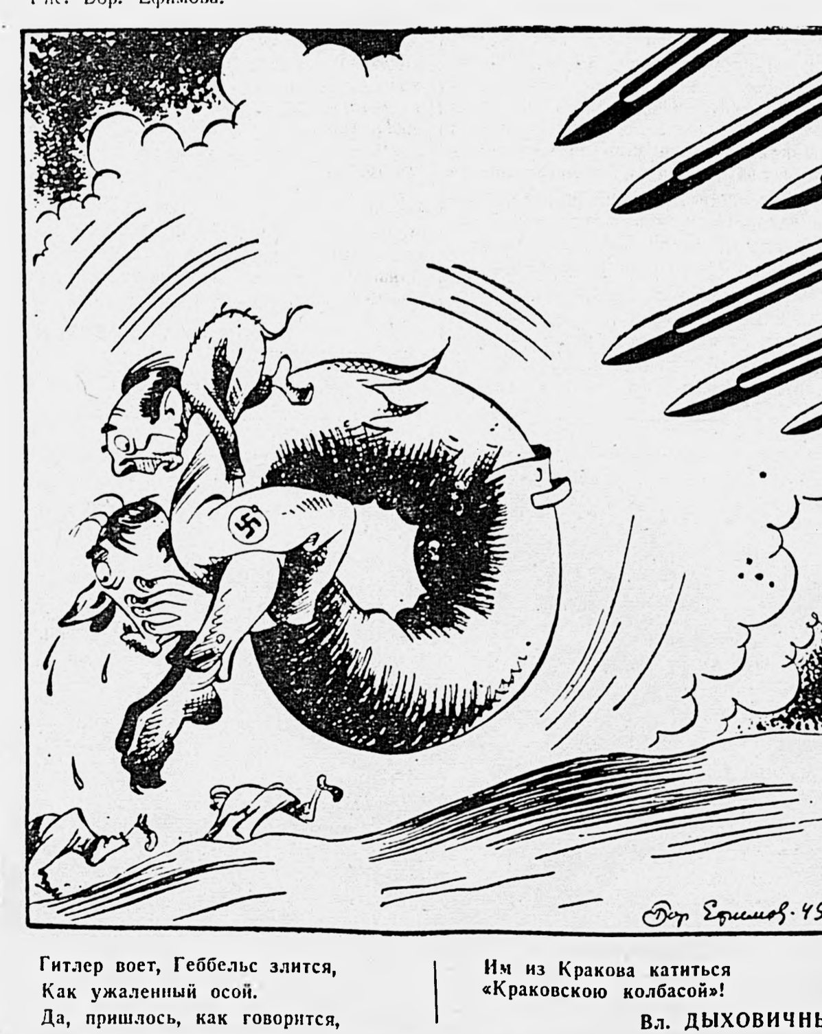
Гитлер вост, Геббельс злится, как ужаленный осой. Им из Кракова катится «Краковская колбаса!»