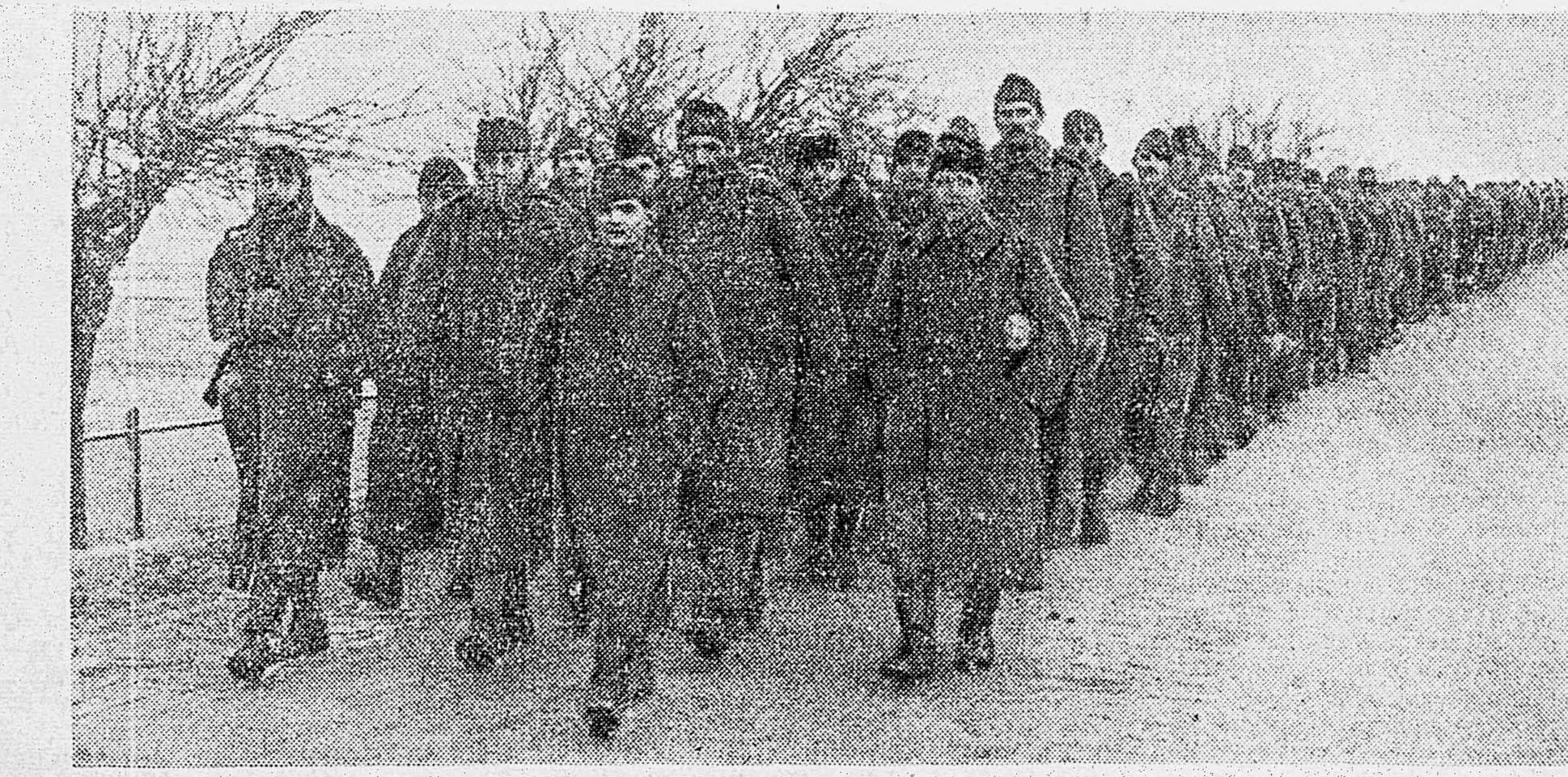
В РАЙОНЕ БУДАПЕШТА. 1. Вражеские солдаты и офицеры, взятые в плен в боях за венгерскую столицу, направляются в тыл. 2. Эшелон с нефтепродуктами, захваченный нашими войсками.