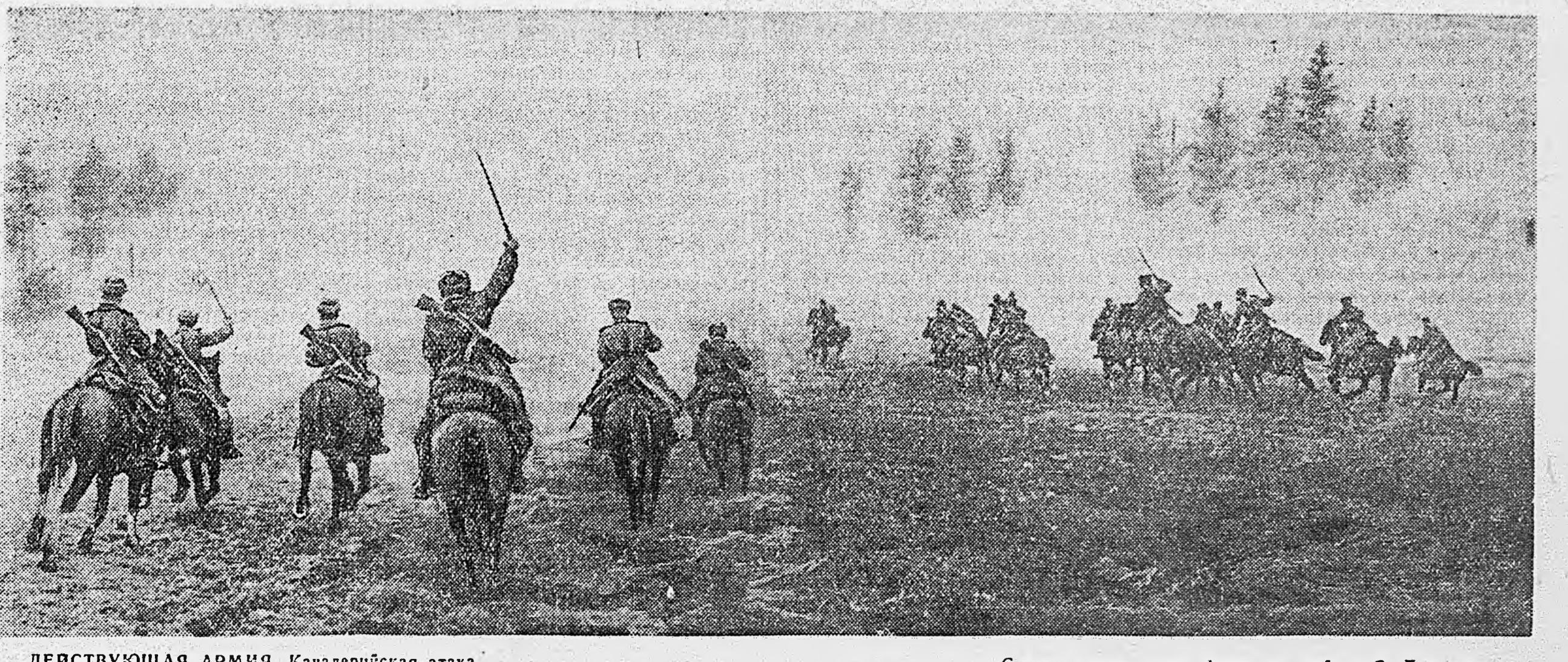
ДЕЙСТВУЮЩАЯ АРМИЯ. Кавалерийская атака.

Юбилейная сессия Академии наук УзССР продлится 6 дней, на секционных заседаниях будет заслушано 90 докладов.