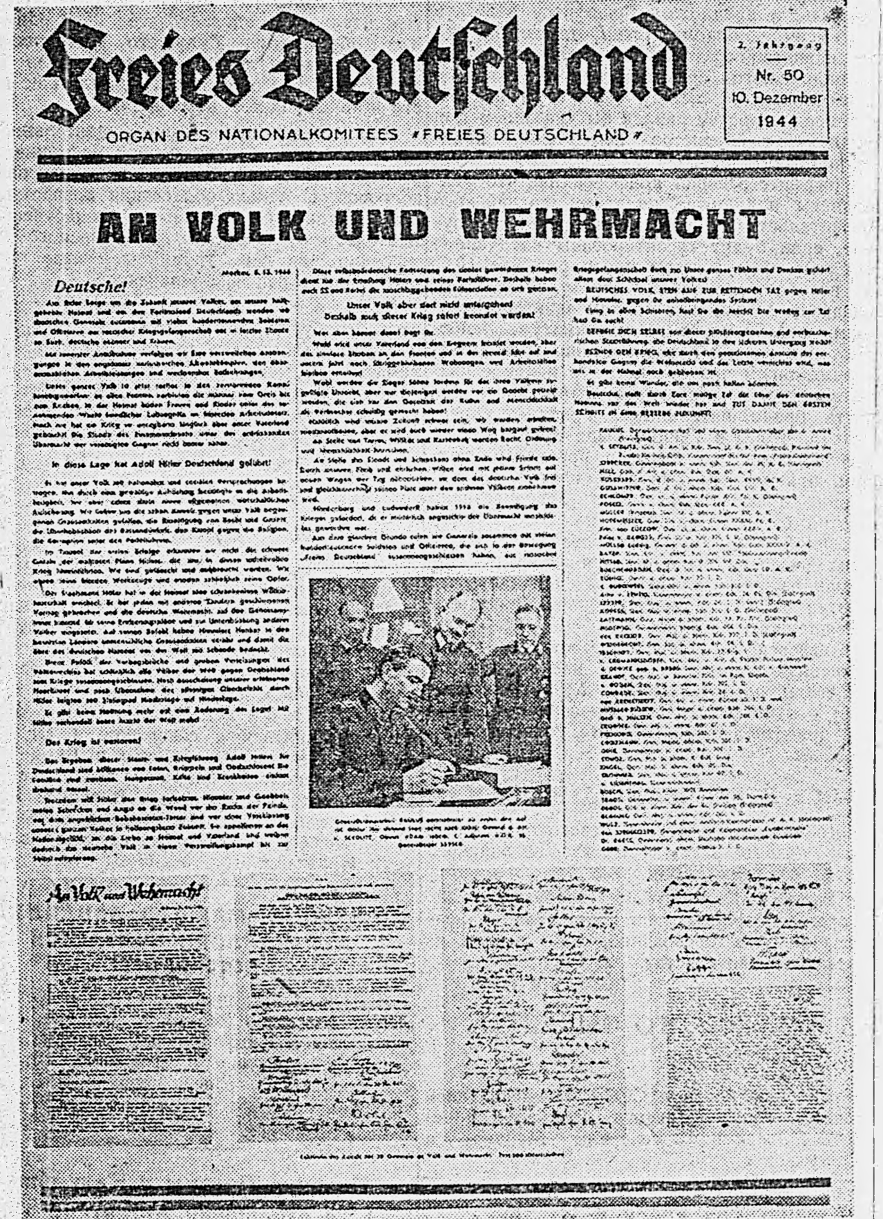
Первая страница газеты «Свободная Германия» № 50 от 10.XII.1944 г.

Наша задача — спасти народ и армию. Мы хотим жить в свободной, независимой Германии, где каждый человек будет иметь право на свободу, равенство и братство с народами других стран. Мы хотим жить в Германии, где закон и справедливость будут главными принципами жизни. Мы хотим жить в Германии, где каждый человек будет иметь право на труд, на образование, на культуру и на участие в управлении государством. Мы хотим жить в Германии, где каждый человек будет иметь право на мир и на сотрудничество с народами других стран.