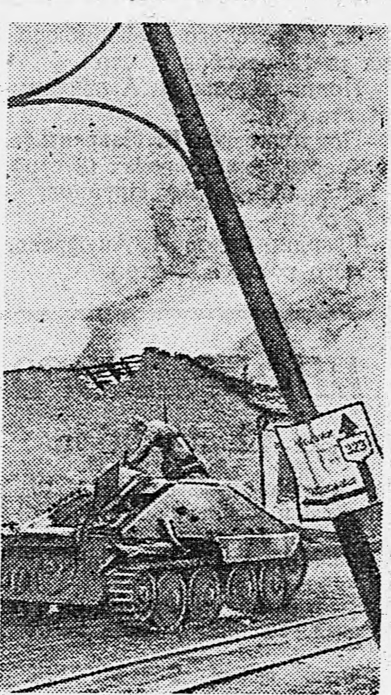
ДЕЙСТВУЮЩАЯ АРМИЯ. Красноармеец осматривает подбитое немецким артиллеристами немецкое самоходное орудие.

Подполковник Н. ЛАВРЕНТЬЕВ. ДЕЙСТВУЮЩАЯ АРМИЯ.