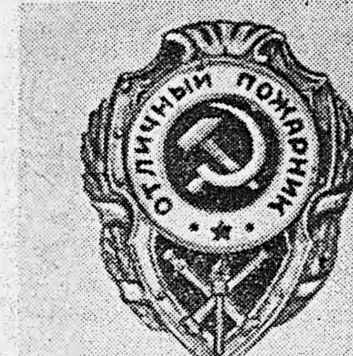
Знак металлический; размер знака по вертикали 46 мм, по ширине 37 мм. На оборотной стороне знак имеет нарезной штифт с гайкой для прикрепления знака к одежде.

За успешное выполнение заданий Государственного Комитета Оборны по ремонту танков для Красной Армии Указом Президиума Верховного Совета СССР награждены: