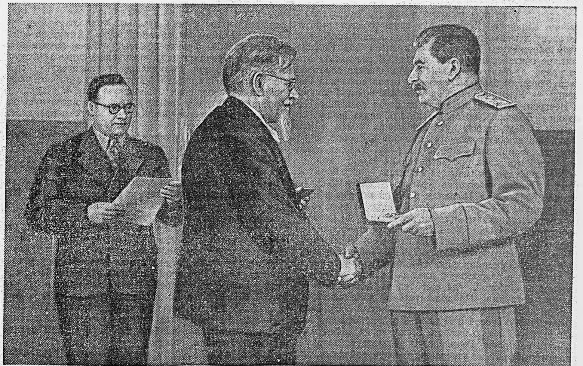
Тов. М. И. Калинин вручает орден «Победа» Маршалу Советского Союза И. В. Сталину.