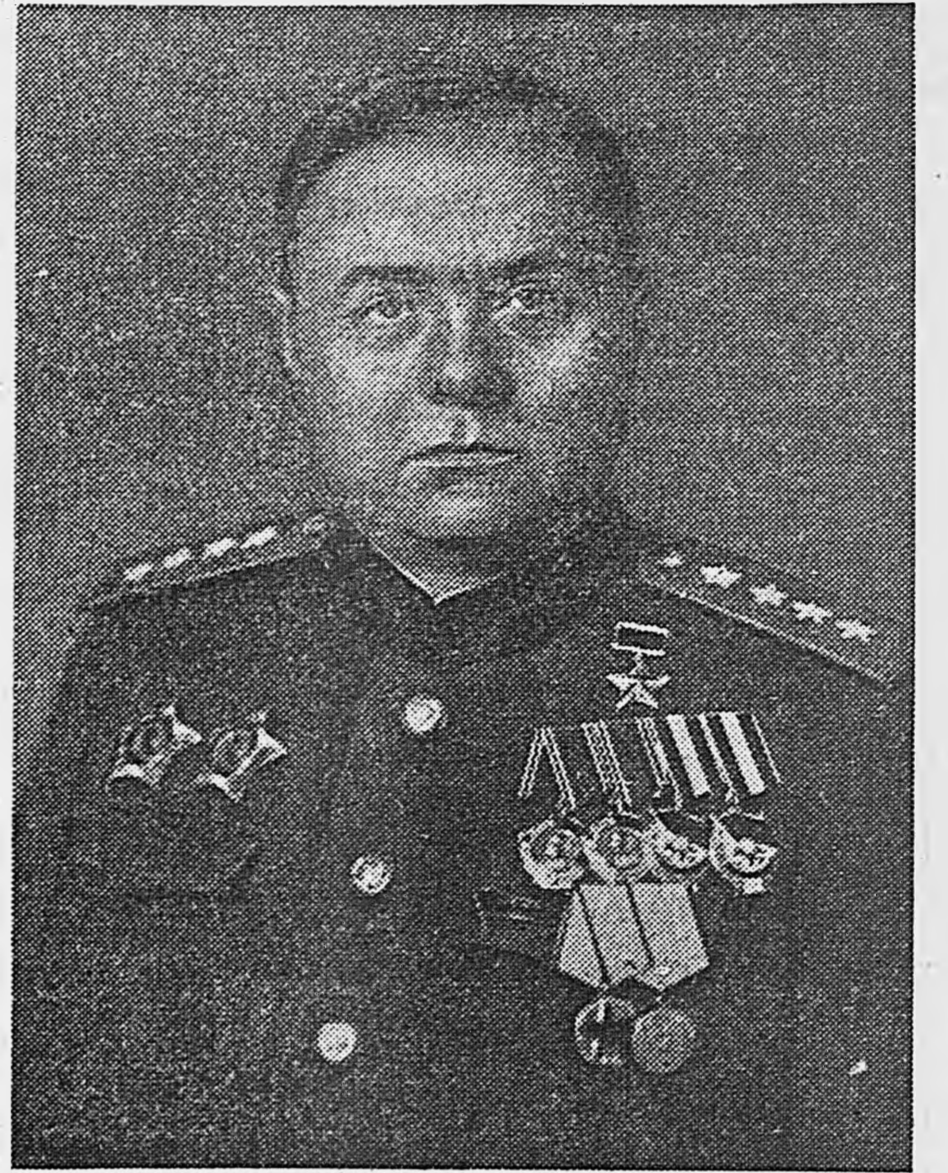
Маршал Советского Союза К. А. Мерецков.

Председатель Совета Народных Комиссаров Союза ССР И. СТАЛИН. Управляющий Делами Совнаркома СССР Я. ЧАДАЕВ. Москва, Кремль, 26 октября 1944 г.