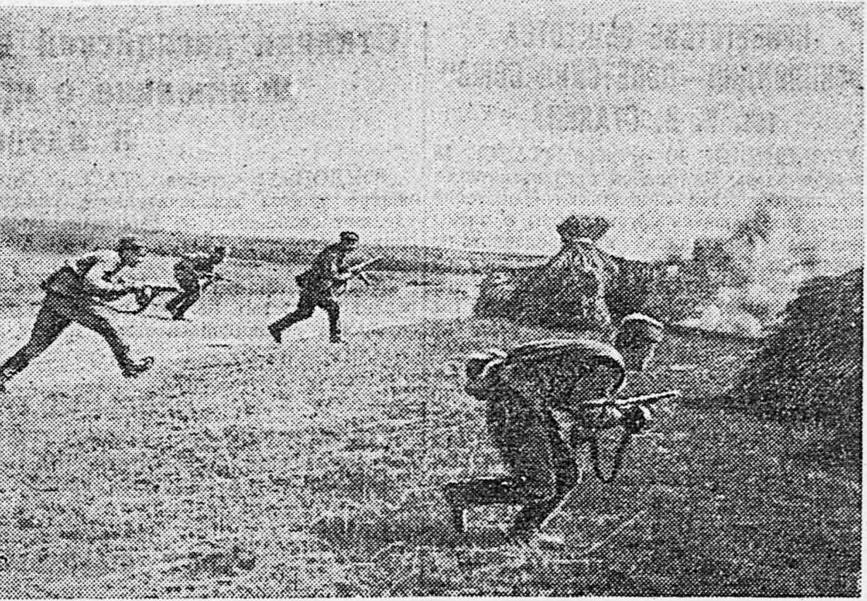
ДЕЙСТВУЮЩАЯ АРМИЯ. Автоматчики идут в атаку.

Пробег проведен в ознаменование годовых итогов боевой учебы пограничников.