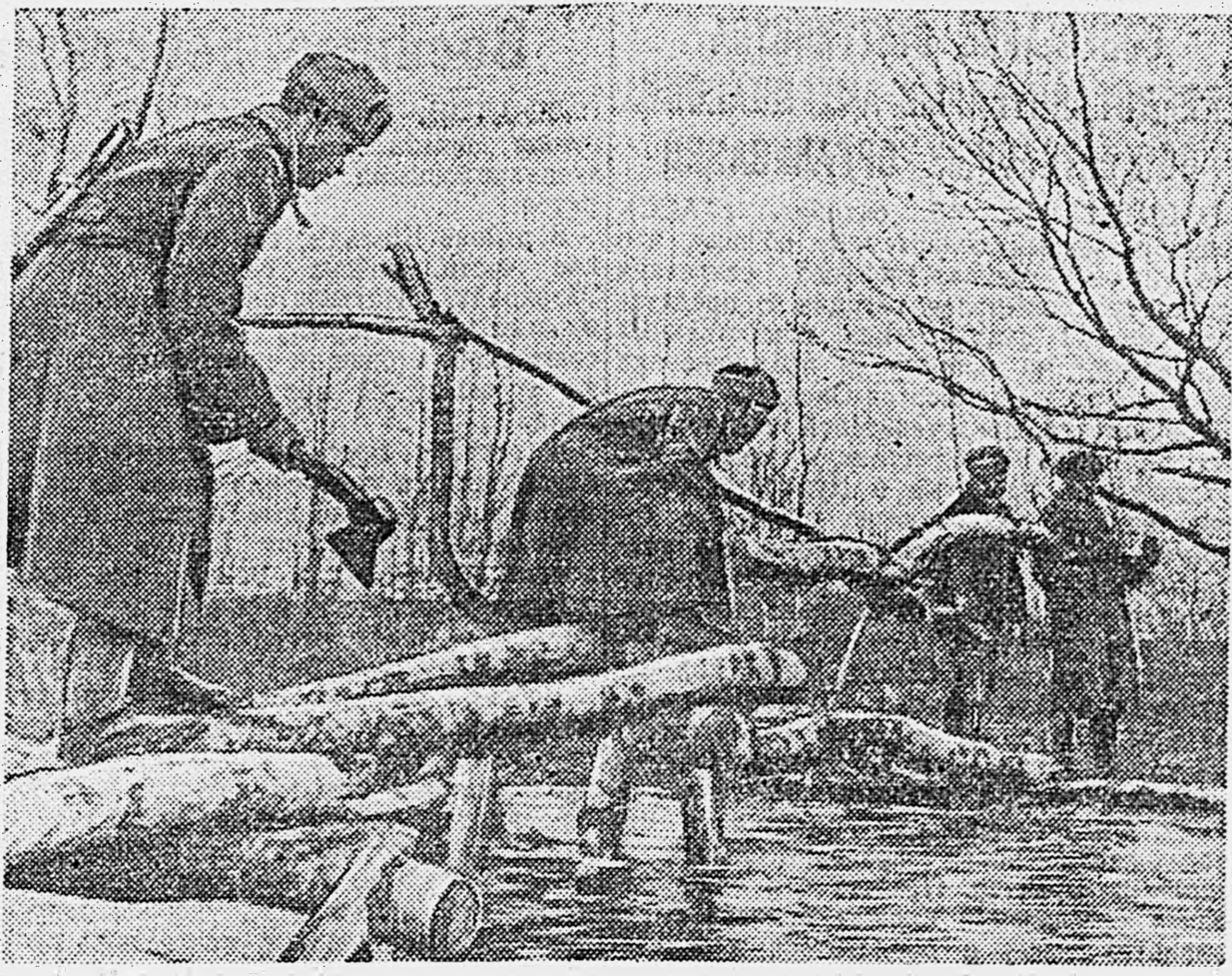
КАРЕЛЬСКИЙ ФРОНТ. Бои наводят переправу через реку.