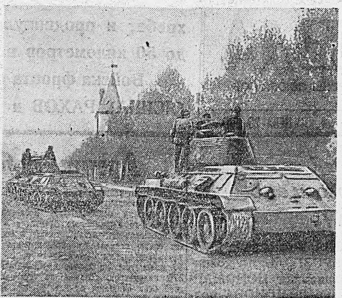
4-й УКРАИНСКИЙ ФРОНТ. В КАРПАТАХ. 1. Советские танки вступают в освобожденный населенный пункт. 2. Артиллеристы ведут огонь прямой наводкой.