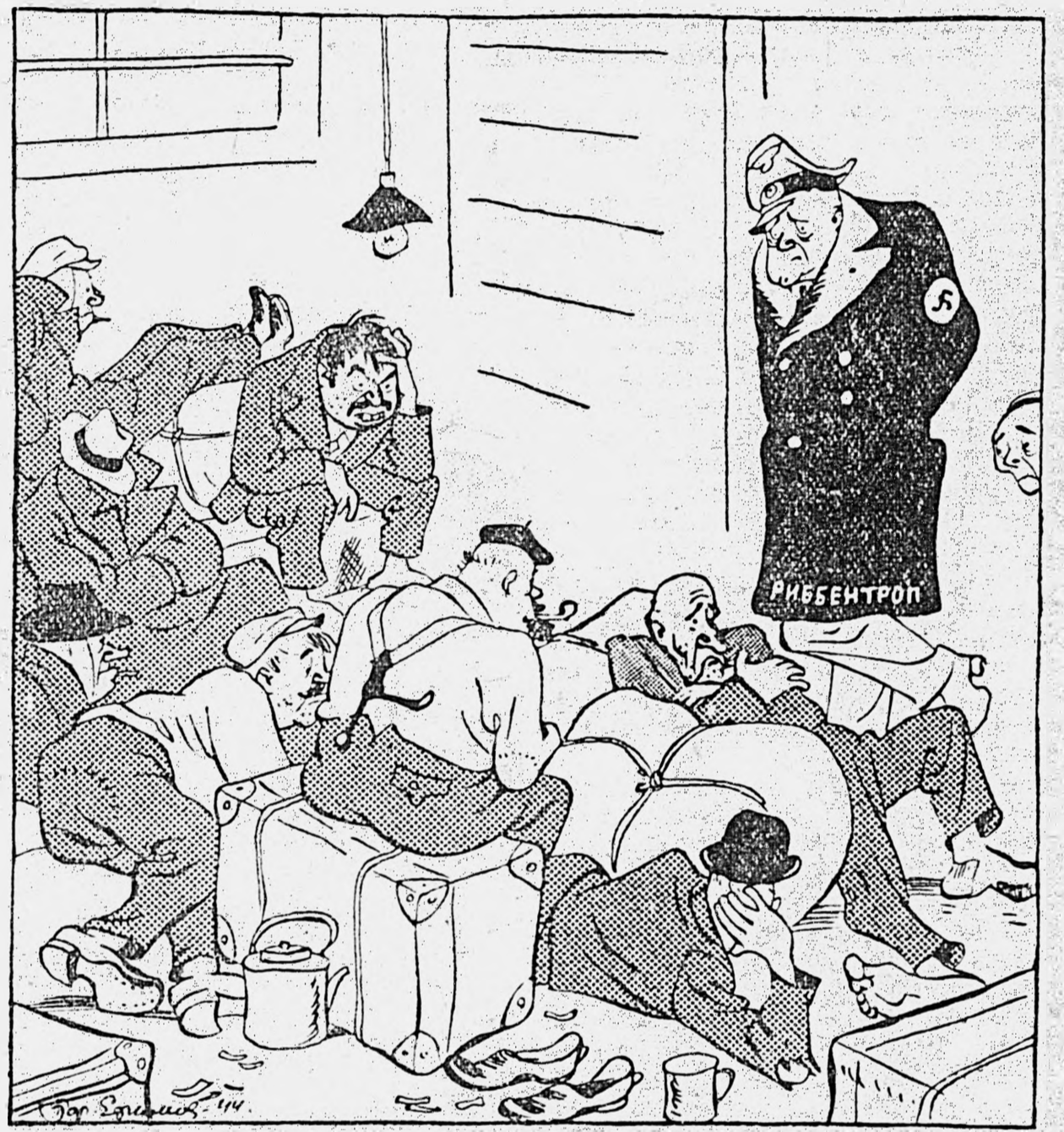
Дипломатический прием у Риббентропа.