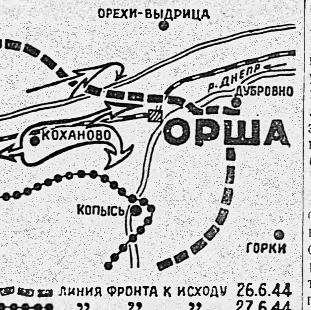
линия фронта к исходу 26.6.44

В оперативном резерве 4 армии находились 8 отдельных полков, расположенных в районе Кожаново — Толочин — Круьки. Такого была в целом группировка немцев, готовившаяся отразить наступление Красной Армии на Оршу (см. схему № 1). Характерно, что незадолго до нашего наступления немецкое командование взяло у всего личного состава подписку