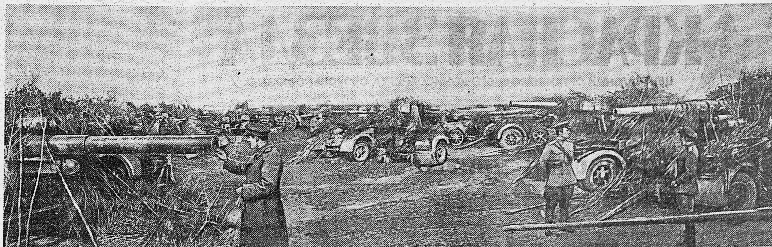
1-й ПРИБАЛТИЙСКИЙ ФРОНТ. Немецкие орудия, захваченные нашими войсками.