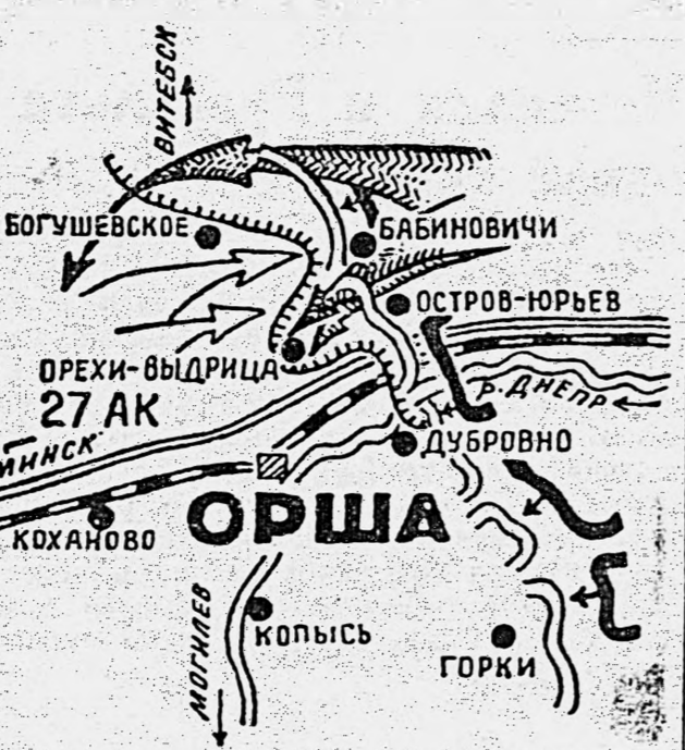
НАША ВОЙСКА обстановка в районе Орша на 23.6.44 линия фронта к исходу 24.6.44

Среди сражений, разыгравшихся в Белоруссии летом текущего года, оршанское является одним из крупнейших. Самое местоположение Орши с ее важнейшим узлом железных дорог определяло размах этого сражения. Прикрывая основное для обороны можно судить по следующим данным. На участке Осиной-Михайловичи оборонявшиеся здесь 78 штурмовая и 25 моторизованная дивизии были усилены 120 штурмовыми орудиями, 80 танками, 78 орудиями РГК и 80 зенитными пушками. Всего здесь было до 550 орудий. На километр фронта тут приходилось 22 немецких орудия. Нужно отметить, что в состав 78 дивизии входило 16 тысяч человек. В среднем на указанный участок