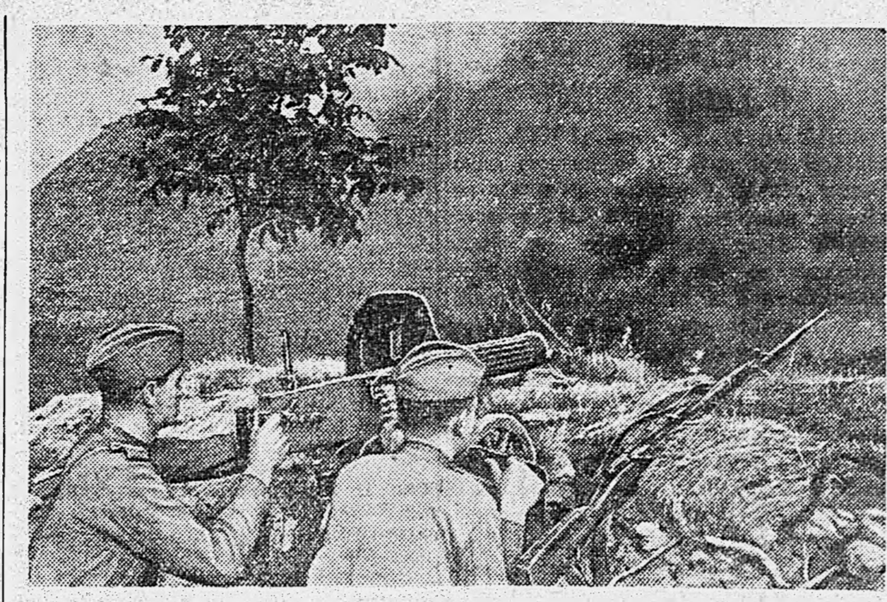
В РУМЫНИИ. Станковый пулемет ведет огонь по немцам.