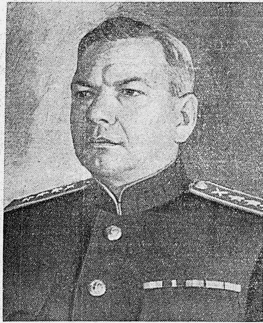
Маршал артиллерии М. Н. ЧИСТЯКОВ.

Пехота использует результаты массированного артиллерийского и авиационного воздействия для того, чтобы в кратчайшие сроки приблизиться к позициям противника и мгновенно атаковать. Совместно с танками и артиллерией она продвигает брешь в оборону и внутри последней рядом быстрых ударов развивает успех в стороны флангов и на всю тактическую глубину.