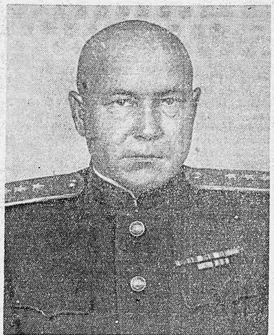
Маршал авиации С. Ф. ЖАВОРОНКОВ.

Генерал-полковнику артиллерии Чистякову Михаилу Николаевичу присвоить военное звание Маршала артиллерии. Председатель Президиума Верховного Совета СССР М. КАЛИНИН. Секретарь Президиума Верховного Совета СССР А. ГОРКИН. Москва, Кремль, 25 сентября 1944 г.