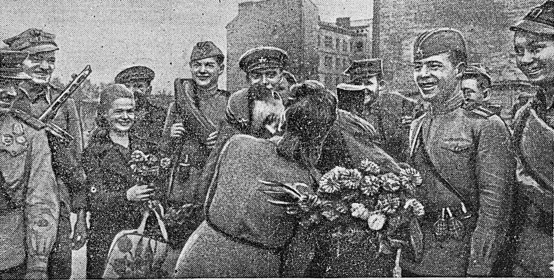
1. Жители освобожденной Праги восторженно встречают советских и польских воинов.