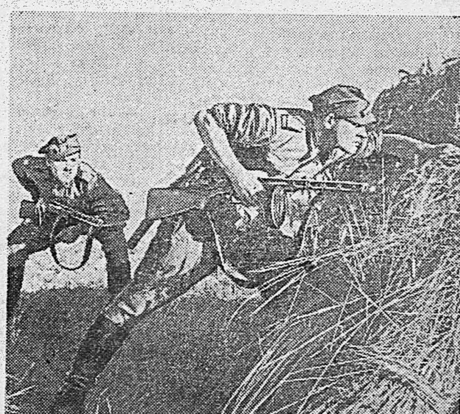
В РАЙОНЕ ПРАГИ. 1. Тяжелые орудия ведут огонь по немецким укреплениям. 2. Общий вид предместья Варшавы — Праги. 3. Польские автоматчики в бою.