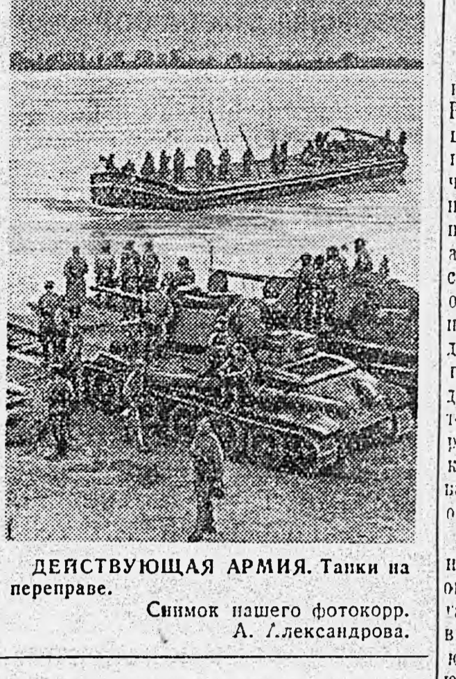
ДЕЙСТВУЮЩАЯ АРМИЯ. Танки на переправе.

Над полями широкими, над садами пестрыми, над Днепром могучим, у Азовского и Черного морей чудесная украинская песня лилась, а среди этих песен звучные были песни о Сталине, о вожде народном, о партии великой — мудрой партии большевиков. Волготно, светло и разностило жили мы! Но вот черная туча накрыла на нашу советскую Родину. Страшная беда ушла на наши головы. Проклятые немцы захватили землю Таврии. По бескрайным