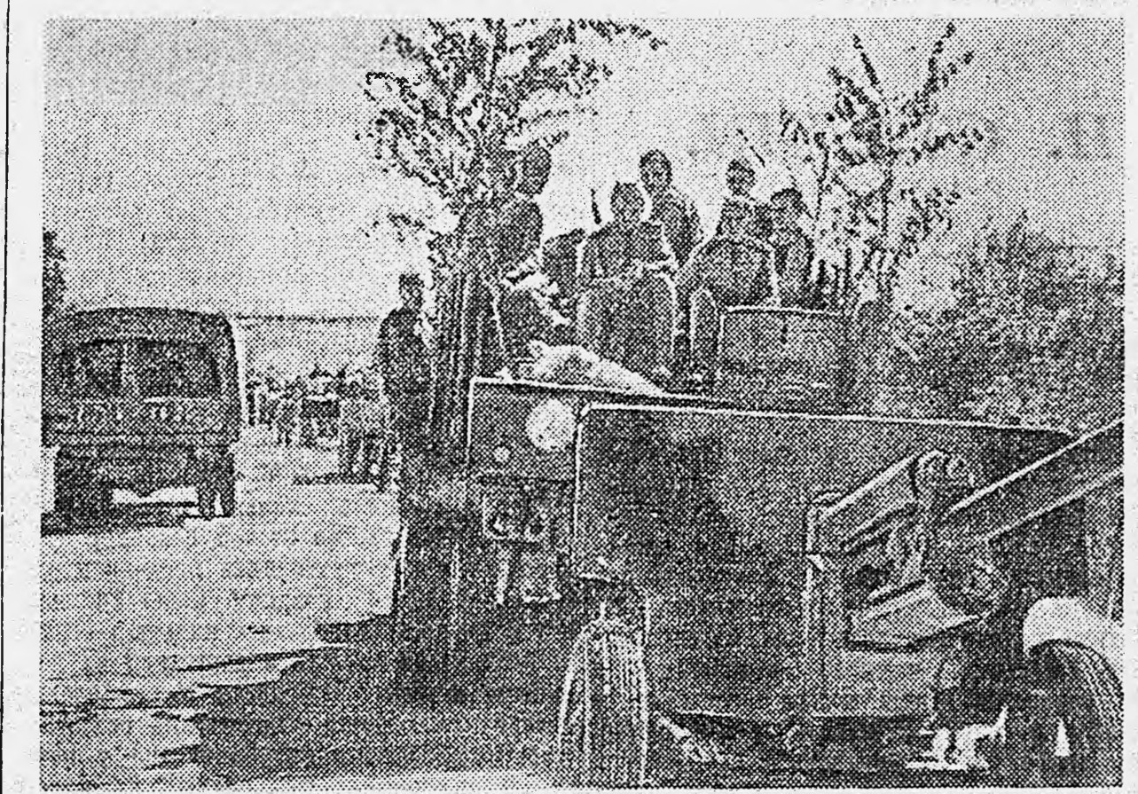
ЗА ДУНАЕМ. Наша артиллерия на марше.

После всестороннего обсуждения доклад тов. Снежкуса пленум принял развернутое практическое решение.