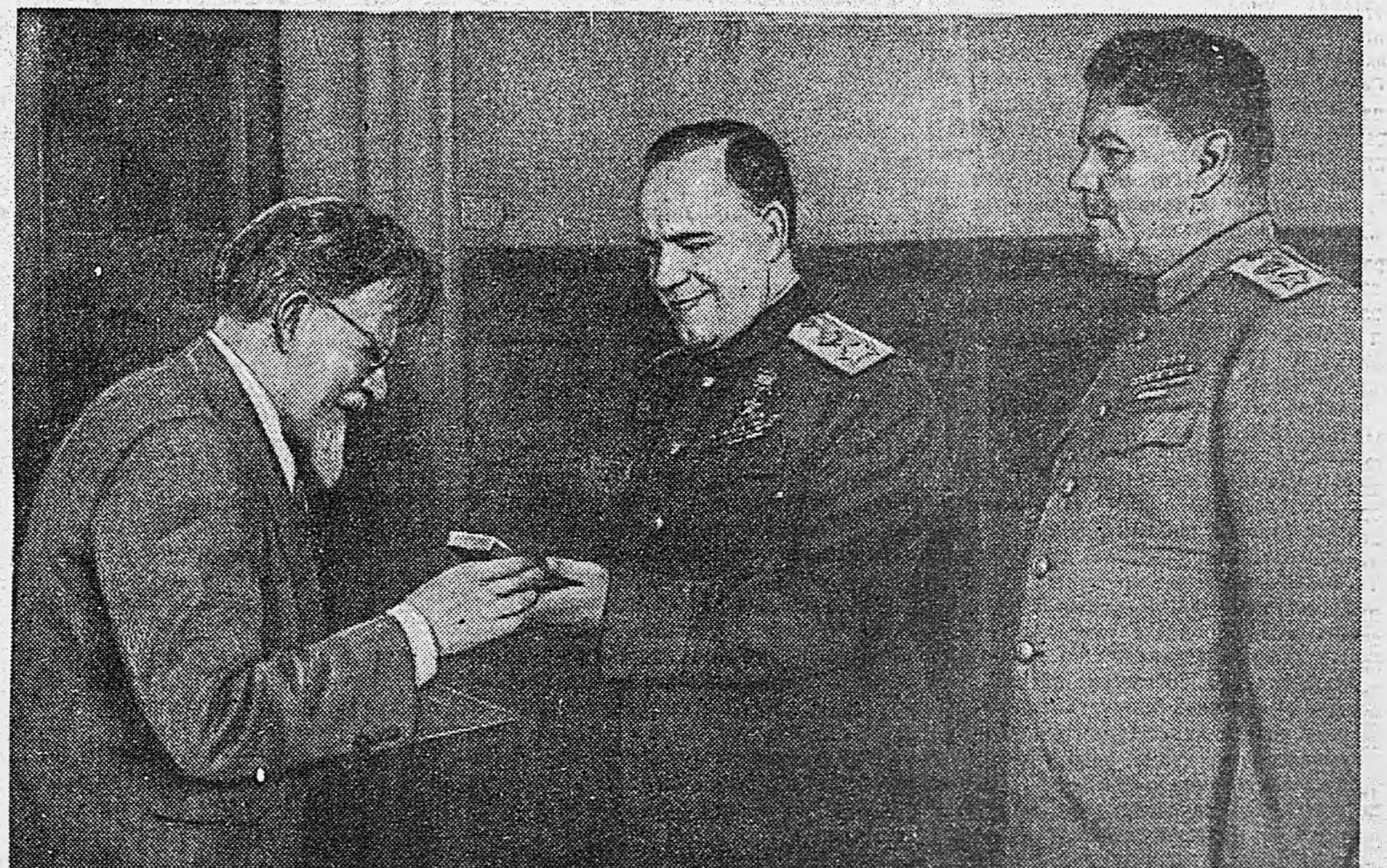
Тов. М. И. Калинин вручает вторую медаль «Золотая Звезда» Герою Советского Союза маршалу Советского Союза Г. К. Жукову. Рядом — Герой Советского Союза маршал Советского Союза А. М. Василевский.

ций успехи, и ордена Ленина и медаль «Золотая Звезда» вместе с грамотой о присвоении звания Героя Советского Союза маршалу Советского Союза А. М. Василевскому, награжденному за образцовое выполнение боевых заданий Верховного Главнокомандования по руководству операциями фронтов против немецких захватчиков и достигнутые в результате этих операций успехи. (ТАСС).