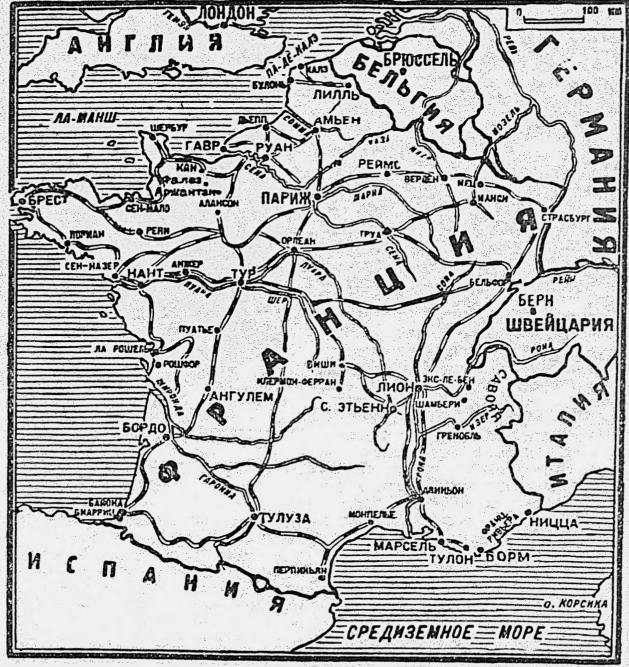
ПОЛОЖЕНИЕ В РАЙОНЕ ВЫСАДКИ В ЮЖНОЙ ФРАНЦИИ

Испанские фалангисты нападают на французских патриотов во французских Пиренеях ЛОНДОН, 16 августа. (ТАСС). По сообщению алжирского корреспондента газеты «Ньюс кроникл», несколько сот испанских фалангистов, находящихся сейчас во французских Пиренеях, часто нападают на французских патриотов. Им помогают другие франкисты, которые с этой целью, с разрешения гитлеровских оккупационных властей, перешли французскую границу. По сообщению корреспондента, француз-