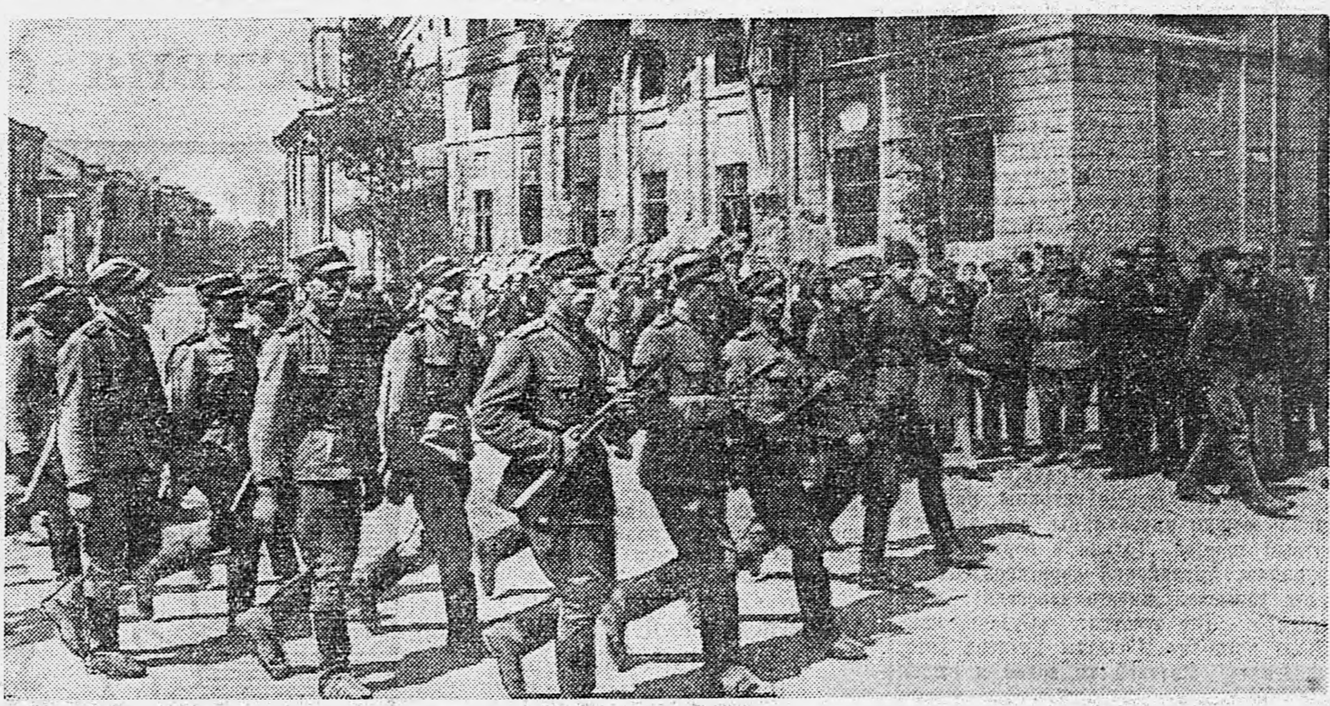
В ЛЮБЛИНЕ. Частн Польского Войска выступают на фронт.