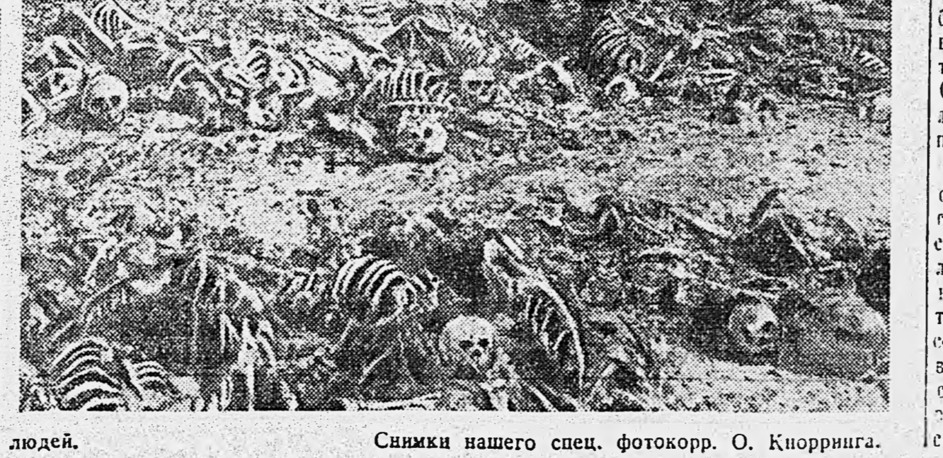
1. Лагерь уничтожения под Люблином. 2. Обугленные останки убитых немцами людей.