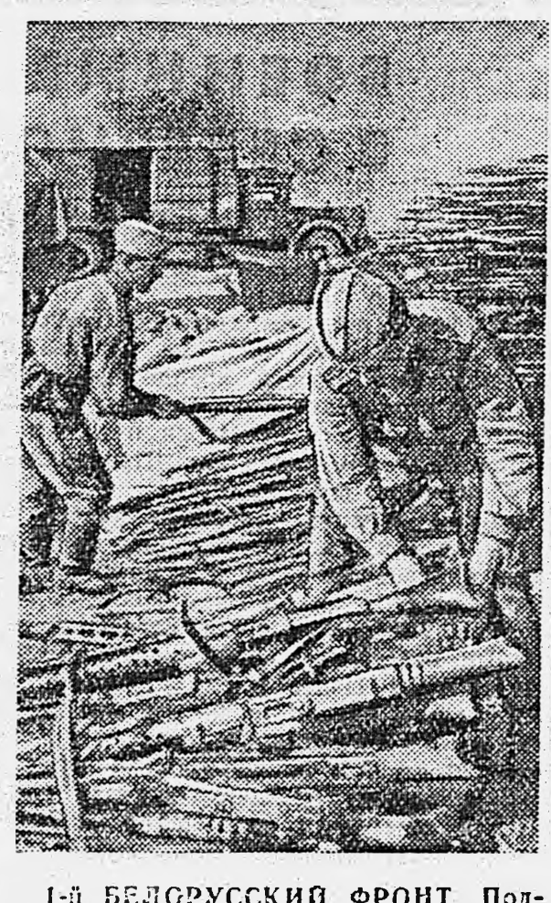
1-й БЕЛОРУССКИЙ ФРОНТ. Подает трюфес.