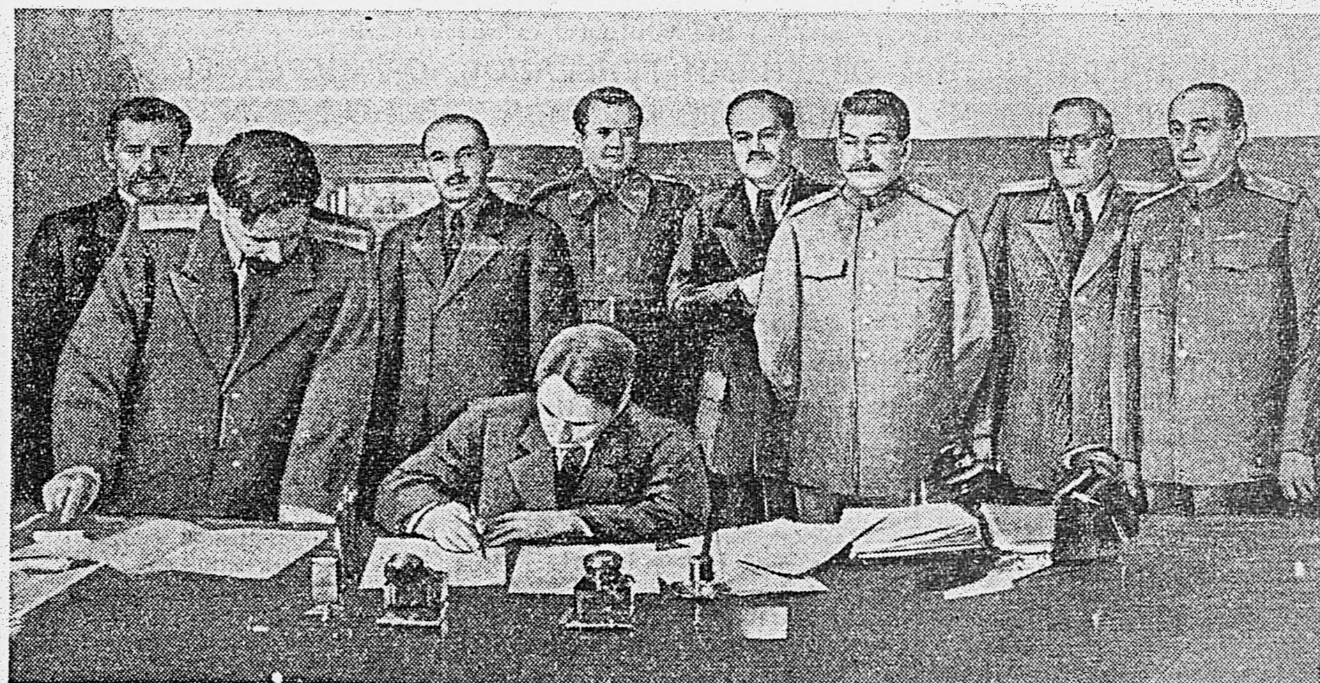
К подписанию Соглашения между Правительством Советского Союза и Польским Комитетом Национального Освобождения об отношениях между Советским Главнокомандующим и Польской Администрацией после вступления советских войск на территорию Польши. На снимках: 1. В. М. Молотов подписывает Соглашение. Стоят (слева направо): А. П. Павлов, А. Витос, Э. Б. Осубка-Моравский, М. Роля-Жимерский, И. В. Сталин, А. Я. Вышинский, Г. С. Жуков. 2. Э. Б. Осубка-Моравский подписывает Соглашение. Стоят (слева направо): Б. Дробнер, А. П. Павлов, А. Витос, М. Роля-Жимерский, В. М. Молотов, И. В. Сталин, А. Я. Вышинский, Г. С. Жуков.