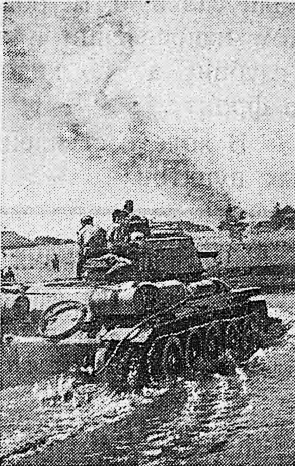
1-й БЕЛОРУССКИЙ ФРОНТ. Танк форсирует волную преграду.