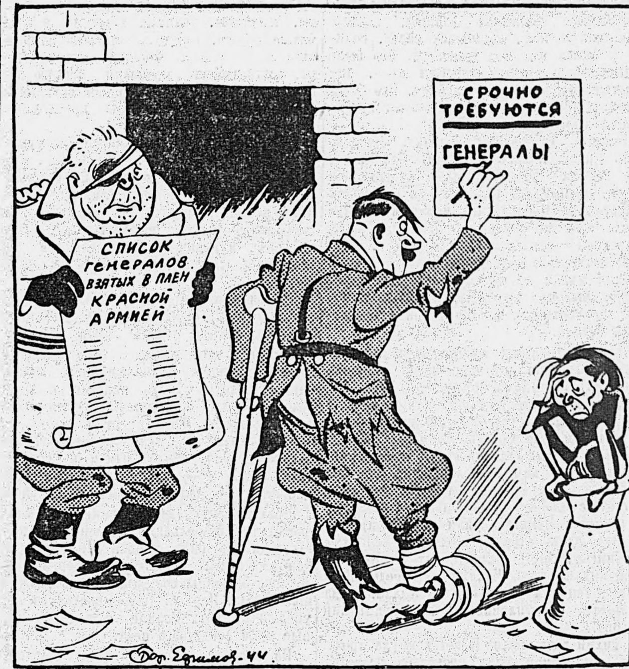
Экстренные меры в гитлеровской ставке.