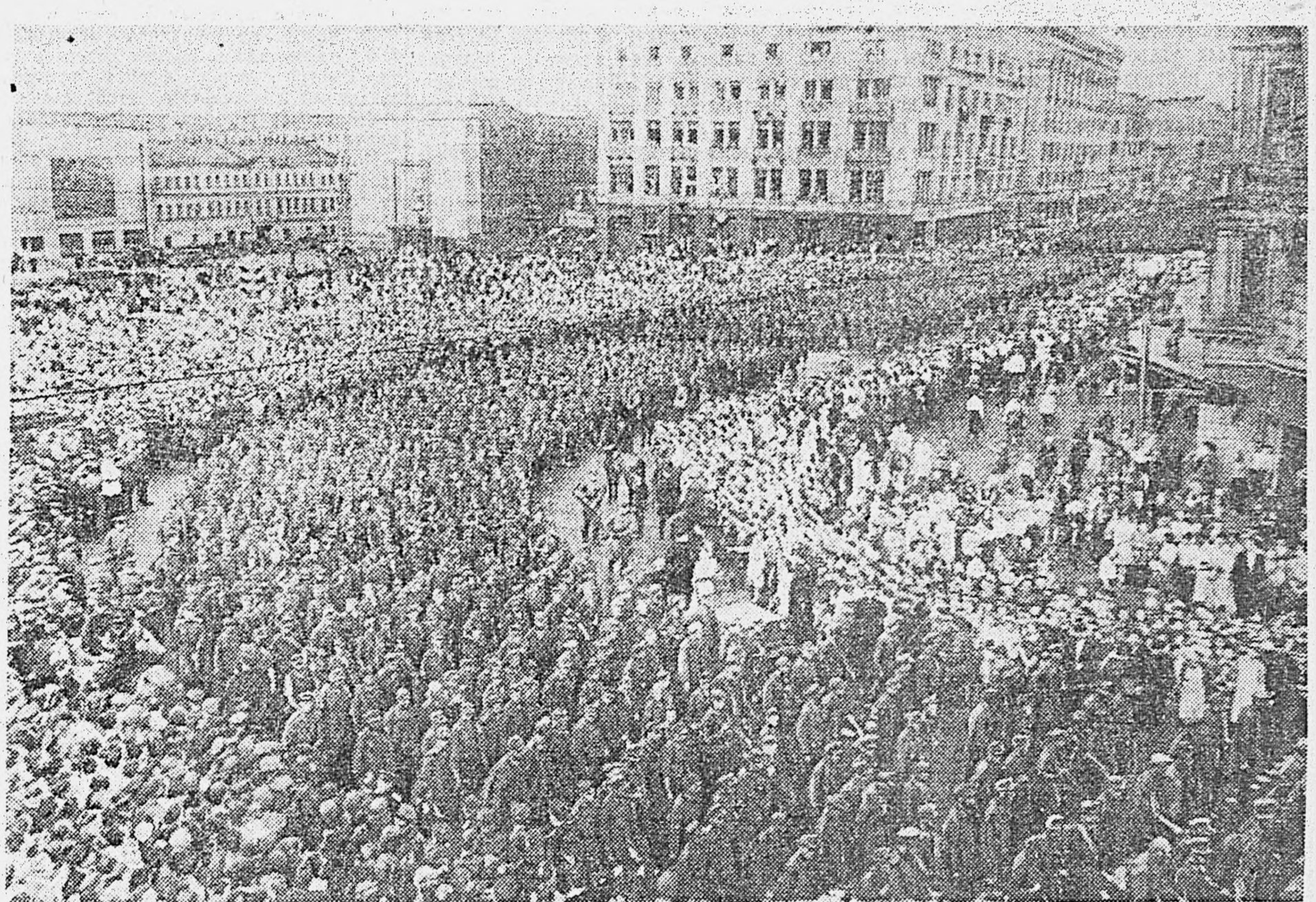
Колонна пленных немецких солдат и офицеров конвоируется на вокзал для отправки в лагерь военнопленных.