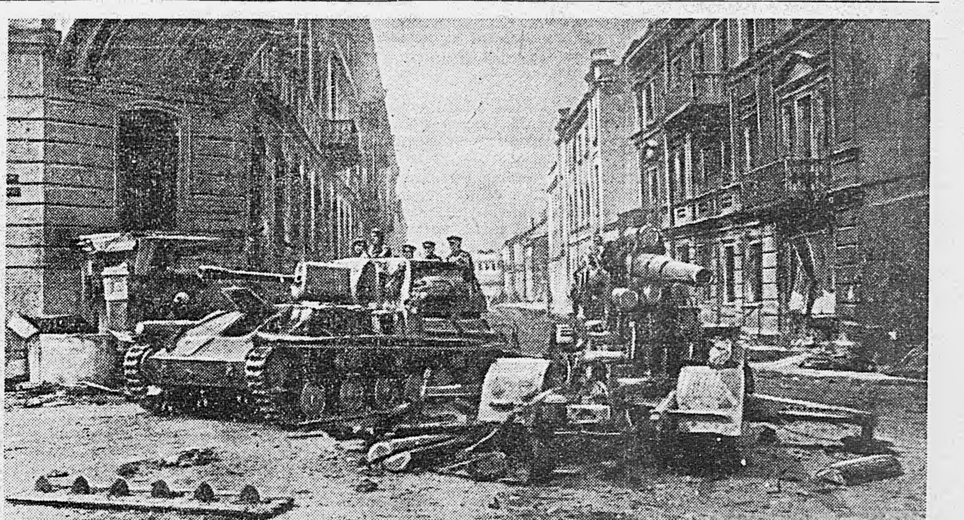
В ГОРОДЕ ВИЛЬНОС. Наше самоходное орудие выдвигается на огневую позицию в одной из улиц. Справа — подбитое немецкое орудие. (Снимок 12 июля. Доставлено на самолете летчиком лейтенантом В. Шипиловым.)

Несколько пикирующих отрядов 4 июля разгромили штаб немецкой войсковой части. Советские патриоты истребили до сотни гитлеровцев, уничтожили радиостанцию и склады с боеприпасами. Захвачено 10 пулеметов, 40 тысяч патронов и другие трофеи.