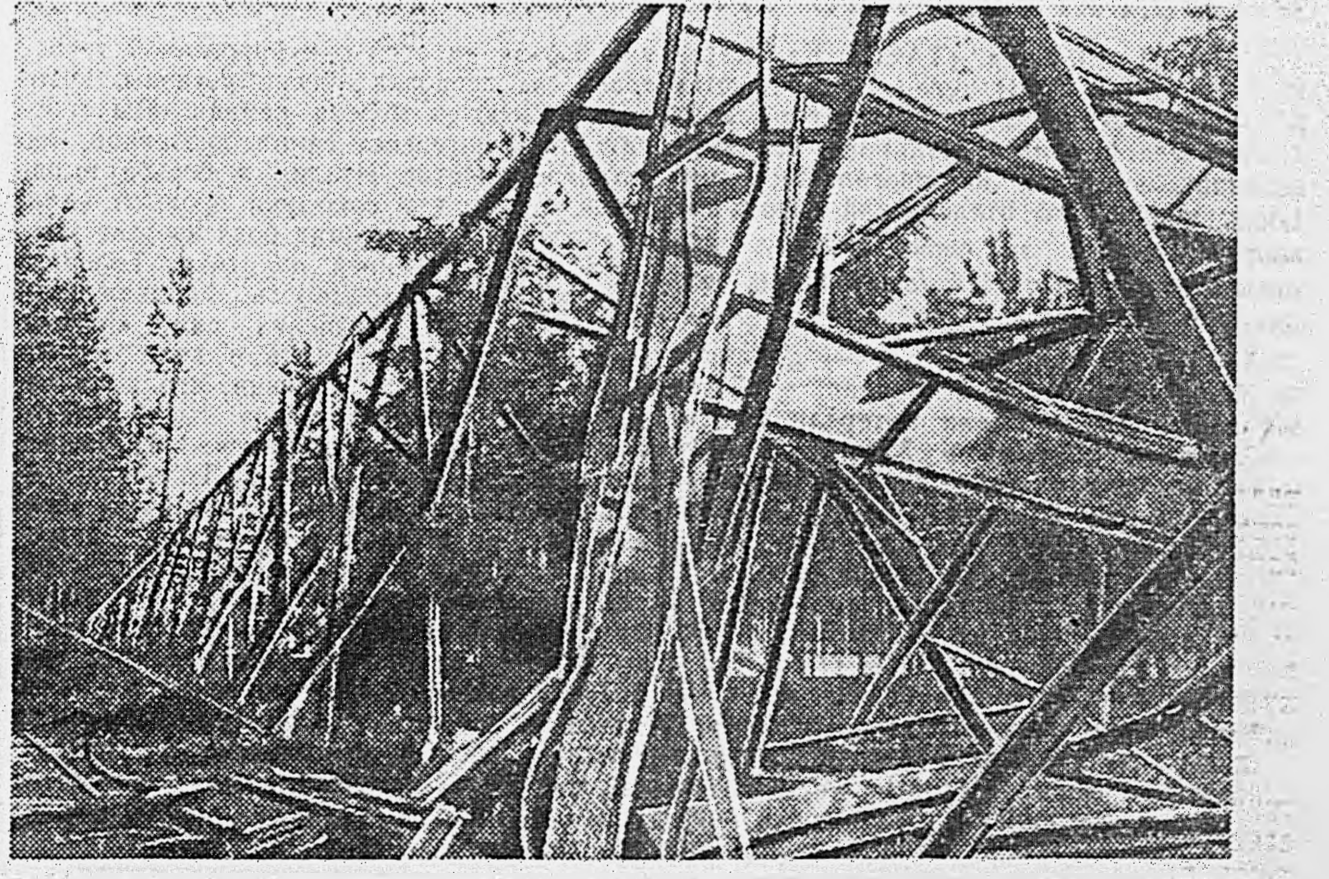
В ОСВОБЖДЕННОМ ГОРОДЕ БАРАНОВИЧИ. 1. Наша артиллерия проходит по улицам. 2. Сваленная взрывом мачта разрушенной немцами радиостанции.