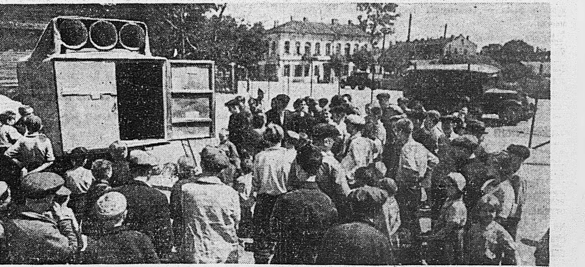
В МИНСКЕ. 1. Наша самоходная артиллерия и танки проходят перед Домом правительства. 2. Население столицы Белоруссии слушает первые советские радиопередачи.