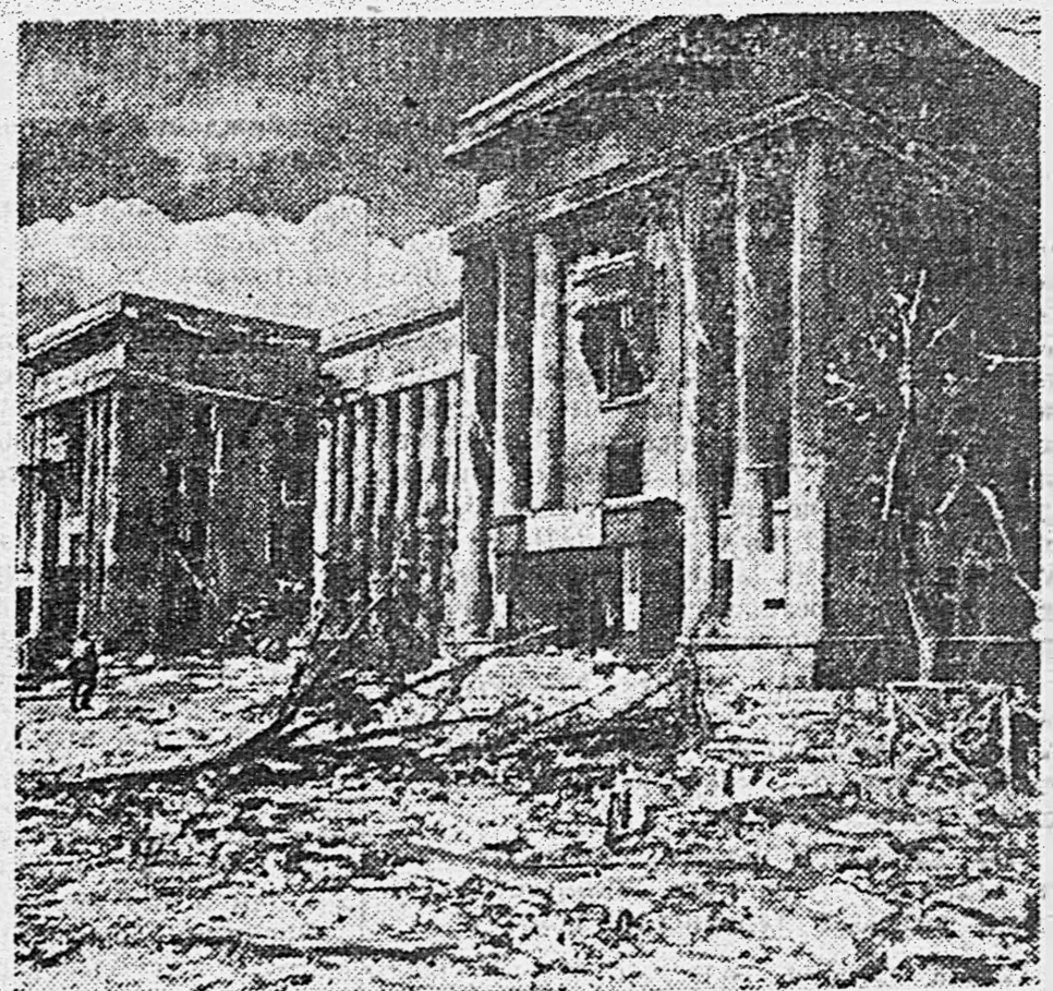
В МИНСКЕ. 1. Лишенные крова жители сожженных немцами домов ютятся в подворотне. 2. Улица Ленина, дотла разрушенная немскими варварами. 3. Дом Красной Армии.