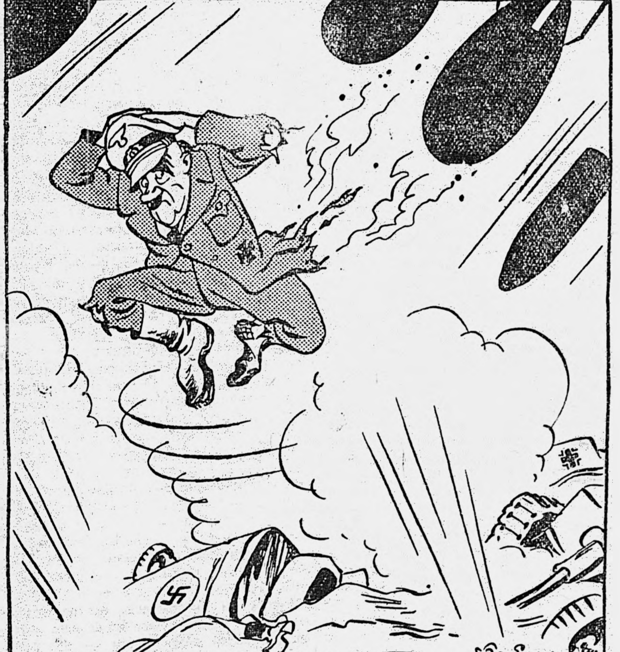
Популярный белорусский танец в стремительном исполнении Адольфа Гитлера.