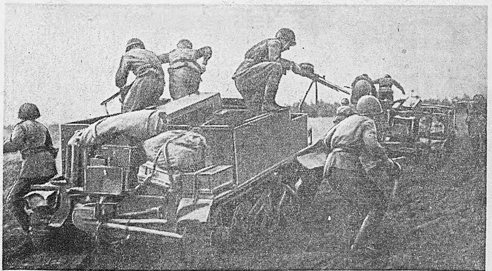
1-й БЕЛУРОССКИЙ ФРОНТ. Десант автоматчиков на бронетранспортерах.

Юго-западнее города Жлобин наши войска, после мощной артиллерийской подготовки и ударов авиации по укреплениям и огневым позициям противника, перешли в наступление. Опираясь на широко развитую сеть траншей и многоэтажные окопы, прикрытые минными полями и проволочными заграждениями, а также водами притоками и болотами, немцы оказали отчаянное сопротивление. Однако советские войска опрокинули противника, прорвали его оборону и, продвигаясь вперед, заняли ряд населенных пунктов. По военным данным, уничтожено более 2.000 гитлеровцев. Одновременно севернее города Рогачев наши войска перервали через реку Друть. Советская пехота, поддержанная мощными ударами артиллерии и авиации, штурмом прорвала глубоко эшелонированную оборону противника и продолжает успешно продвигаться вперед. На поле боя осталось свыше 1.700 вражеских трупов. Захвачено много трофеев и пленных. ***