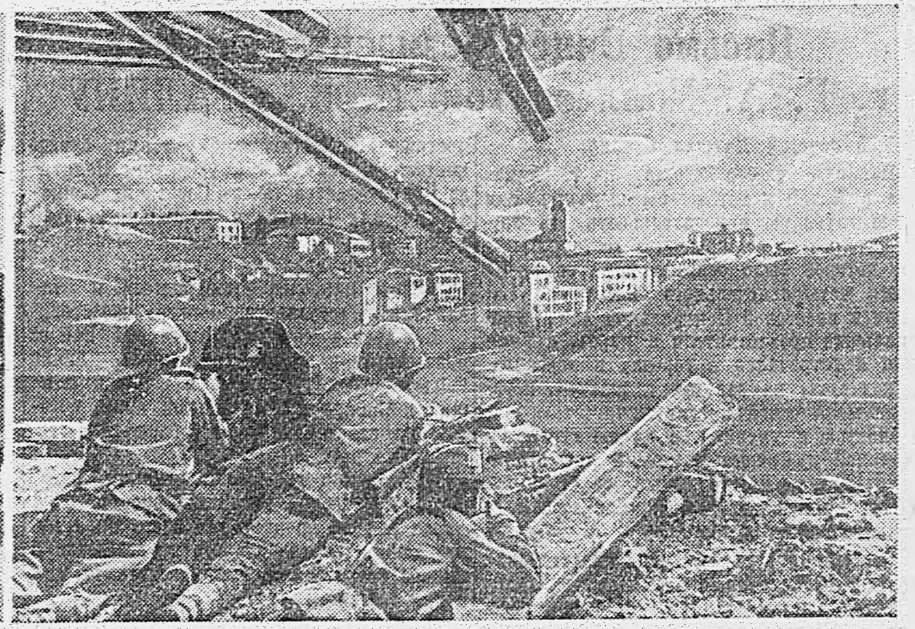
В ОСВОБОЖДЕННОМ ВИТЕБСКЕ. 1. Население города приветствует освободителей — воинов Красной Армии. 2. Колонна пленных гитлеровцев направляется из Витебска в тыл. 3. Пулеметчики обстреливают гитлеровцев, зашедших на окраине за Западной Двиной.