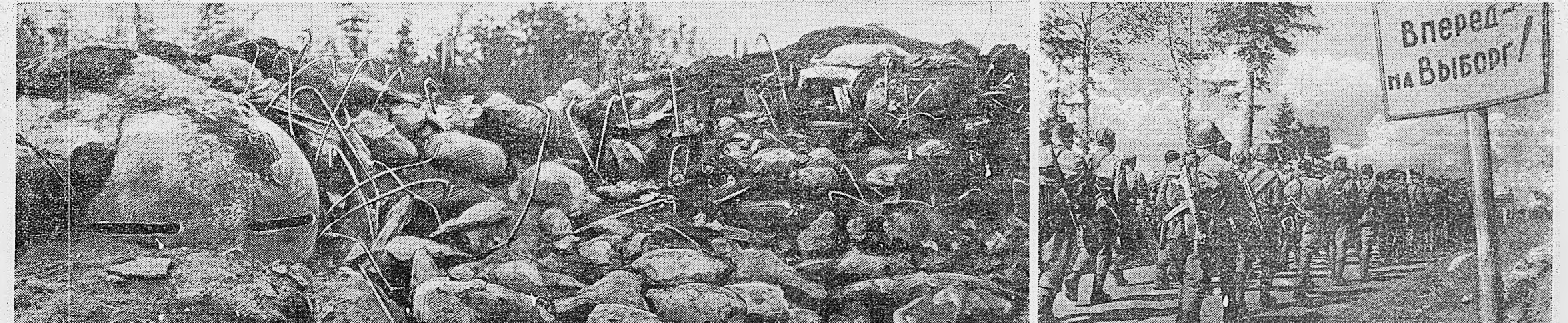
КАРЕЛЬСКИЙ ПЕРЕШЕЙК. 1. Финский дот, взятый штурмом войсками Ленинградского фронта. 2. Наши стрелковые подразделения выдвигаются в район прорыва финской обороны.