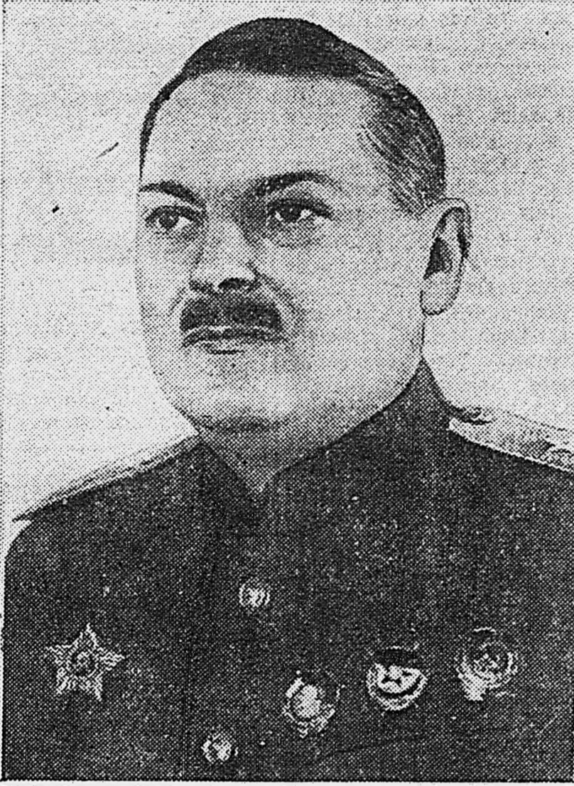
Генерал-полковник А. А. ЖДАНОВ.