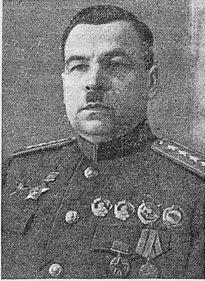
Маршал Советского Союза Л. А. ГОВОРОВ.

В колхозах Ставропольщины началась выборочная уборка зерновых СТАВРОПОЛЬ, 19 июня. (ТАСС). В восточных районах края созревают озимая пшеница и ячмень. В колхозах Буденновского района обжариваются участки, выде-