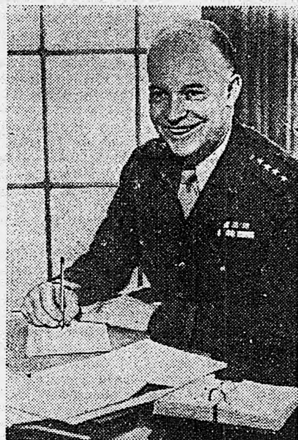
Генерал Дуайт Эйзенхауэр.

Ваша задача будет велика. Вы хорошо обучены, хорошо оснащены и закалены в боях. Он будет яростно сражаться. Но мы живем в 1944 году. Многие произошли с тех пор, как мысты одерживали победы в 1940 и 1941 гг. Обедневшие нации нанесли немцам крупные поражения в открытых боях лицом к лицу. Наше воздушное наступление серьезно сократило их силу в воздухе и их способность вести войну на суше. Наш внутренний фронт делами повелевающие превосходство в области вооружения и боеприпасов, предоставил в наше распоряжение крупные резервы обученных солдат. Положение изменилось. Свободные люди во всем мире идут к победе. Я вполне уверен в вашей храбрости, преданности долгу и боевом мастерстве. Мы не согласимся ни на что меньшее, чем полная победа.