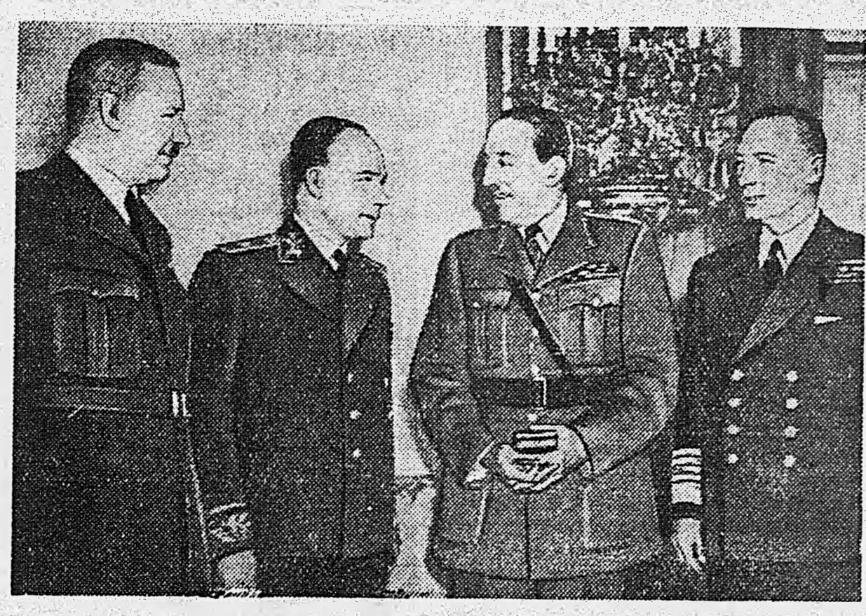
16 мая с. г. посол СССР в Англии т. Ф. Т. Гусев вручил орден Суворова 1 степени награжденным Президиумом Верховного Совета СССР руководящим лицам английских вооруженных сил. На снимке (слева направо): главный маршал авиации сэр Артур Гаррис, советский посол Ф. Т.

Два фронта в эту зимнюю ночь, как две руки, сходящиеся по карте, двигались, всё приближаясь друг к другу, готовые соединиться в Донских степях, далеко позади Сталинграда.