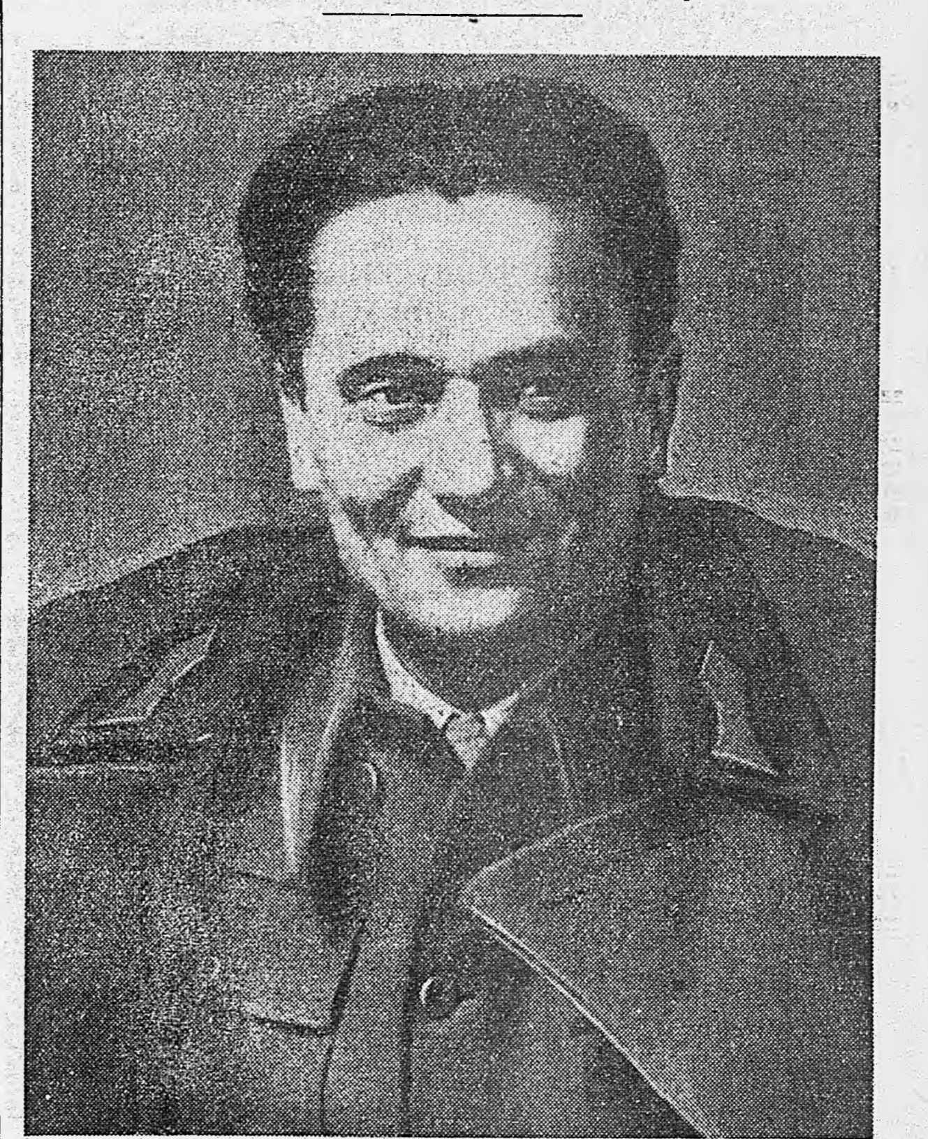
Верховный Главнокомандующий Народно-Освободительной армии Югославии и председатель Национального Комитета Освобождения Югославии Маршал Иосип Броз-Тито.

19 мая маршал Советского Союза И. В. Сталин принял представителей народно-освободительной армии Югославии — главу военной миссии генерала Терзича и члена военной миссии генерала Джиласа.