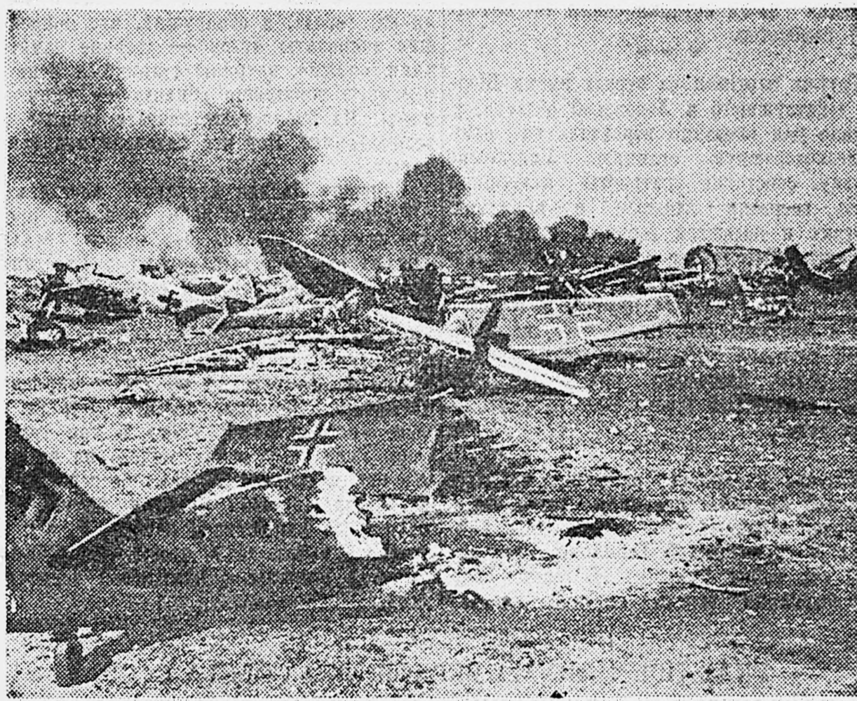
Действующая армия. Аэродром противника, разбитый нашей авиацией.