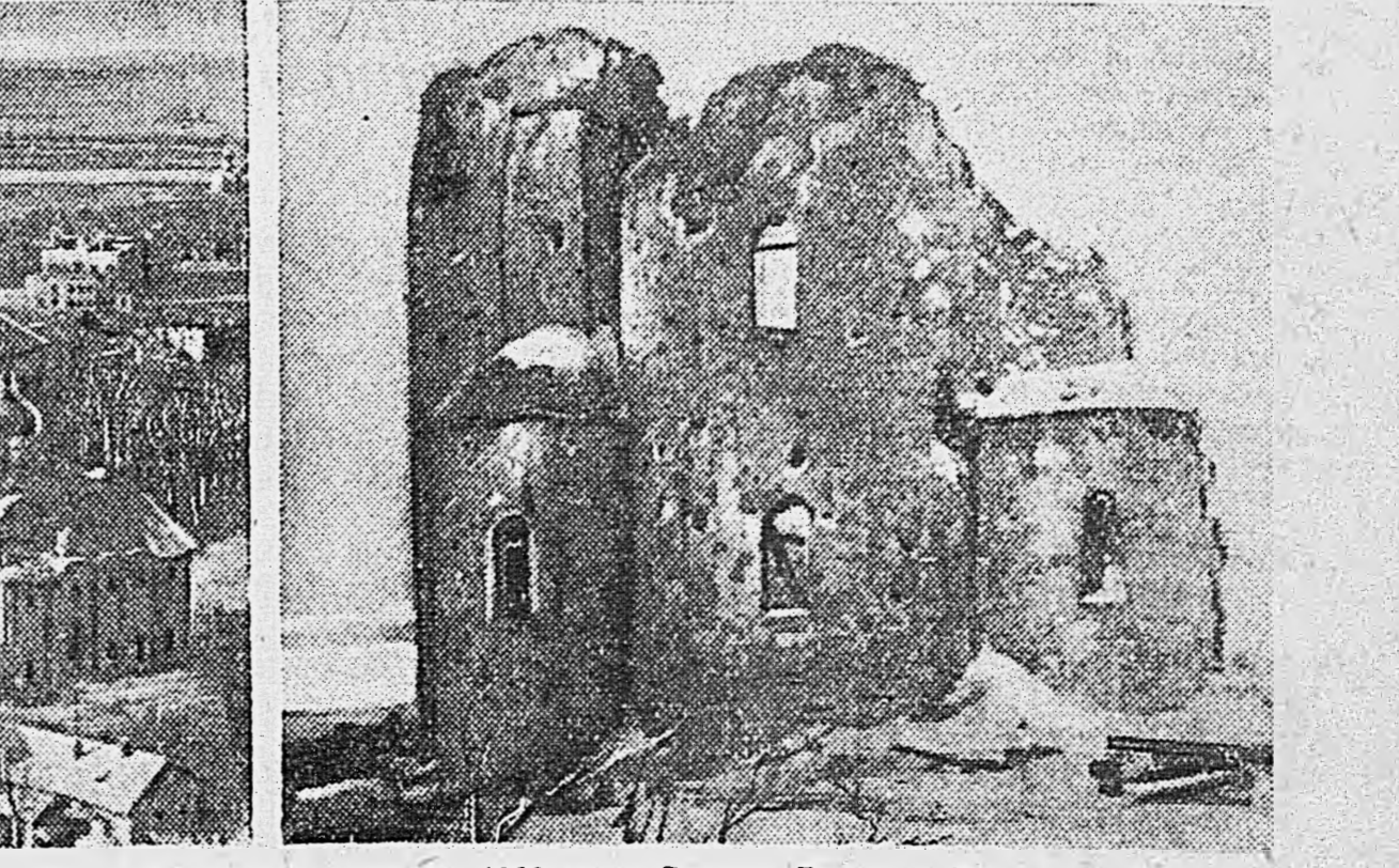
Г. НОВГОРОД. На снимках: 1. Разрушенный памятник 1000-летия России и разбитые части памятника. 2. Справа — Софийский собор (XI в.). В центре — разобранный немцами памятник 1000-летия России. Слева — у Кремлевской стены — разрушенные немцами звонница (XVI в.), За Кремлем — уничтоженные немцами кварталы города. 3. Церковь Спаса-Нередица (XII в.), превращенная немцами в развалины.