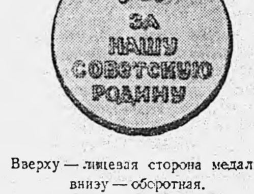
Вверху — лицевая сторона медали, внизу — оборотная.