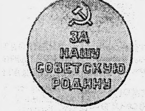
Вверху — лицевая сторона медали, внизу — оборотная.