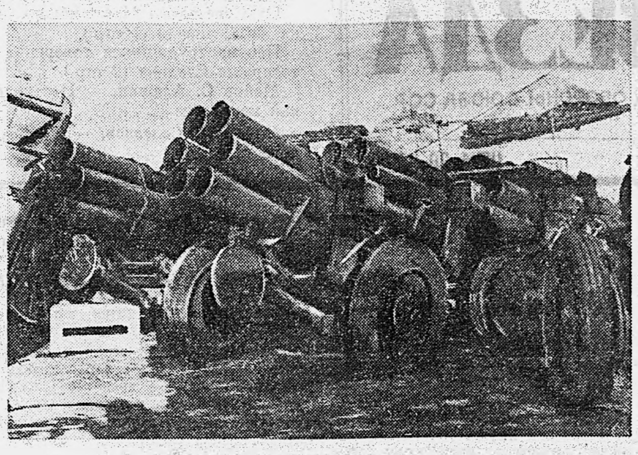
3-й УКРАИНСКИЙ ФРОНТ. Немецкие шестиствольные минометы, захваченные нашими войсками.