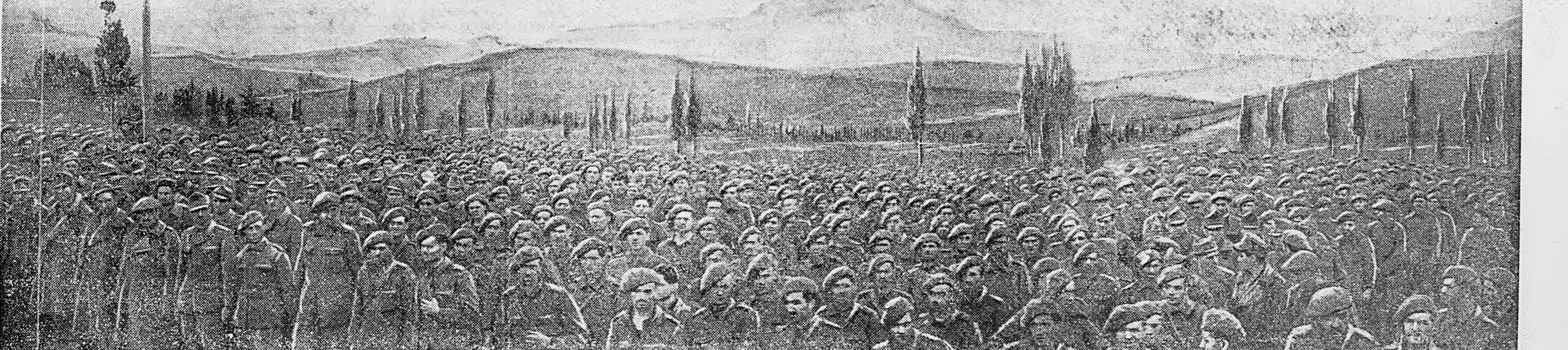
КРЫМ. АЛУШТА. Пленные румыны, захваченные нашими войсками.