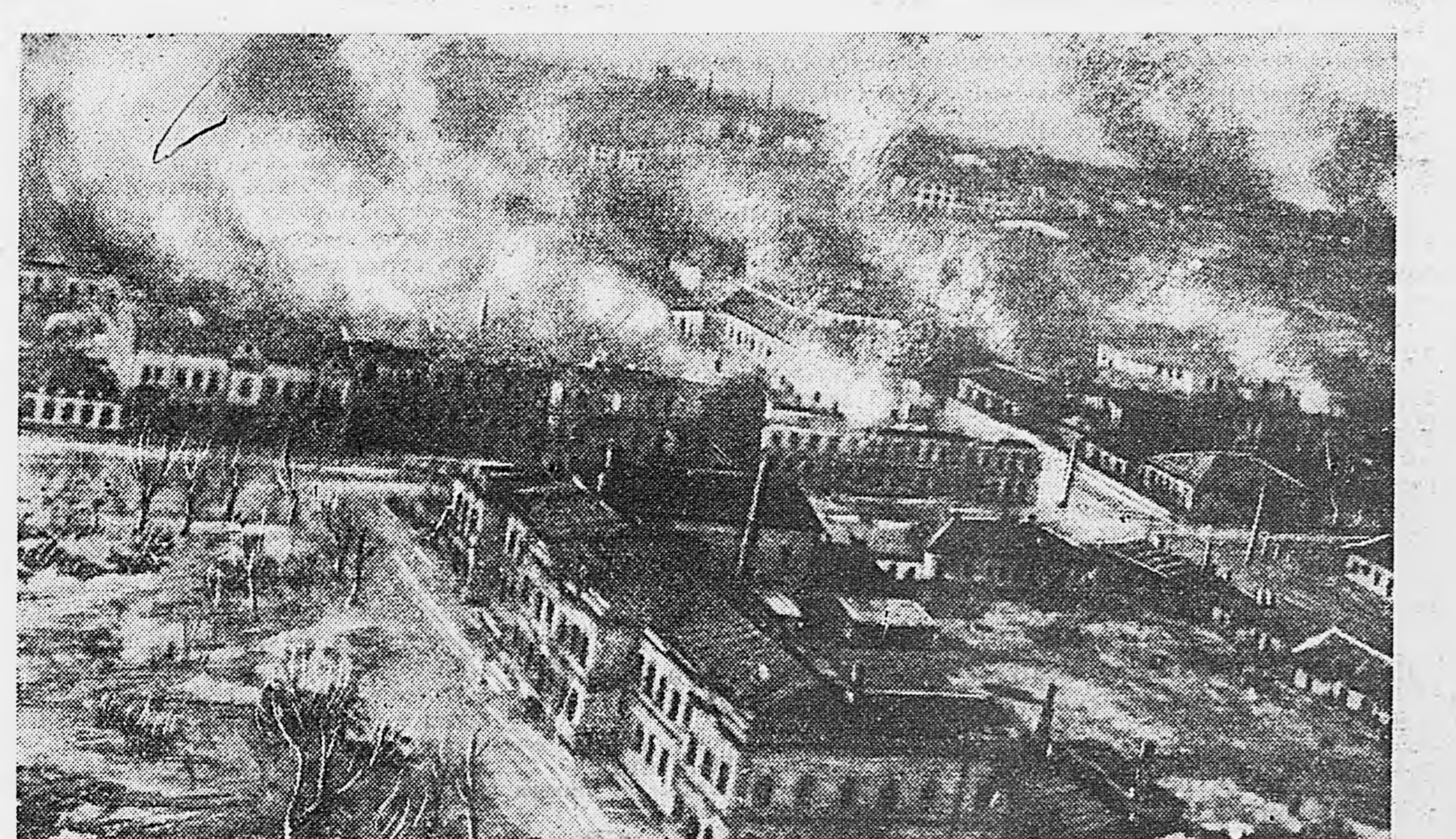
Город Николаев в огне. Таким его снял наш фотокорреспондент с самолета в день занятия Николаева частями Красной Армии 28 марта.