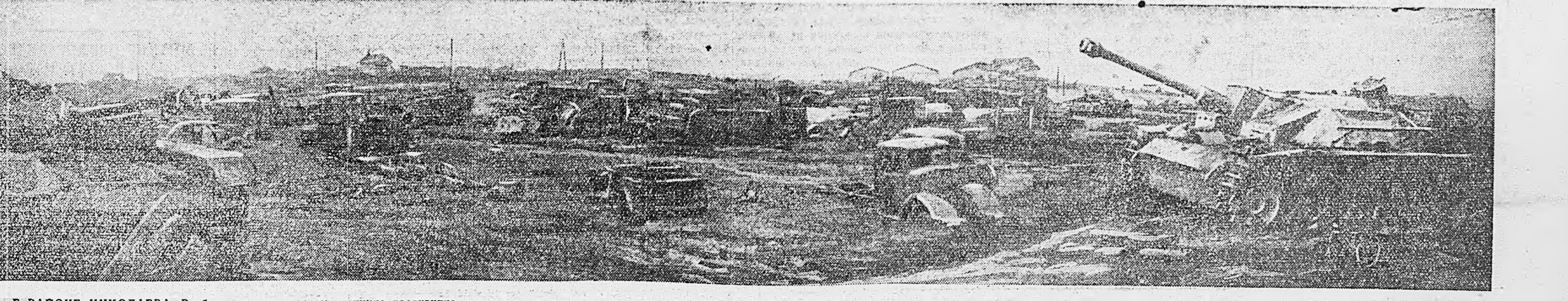
В РАЙОНЕ НИКОЛАЕВА. Разбитая нашими частями техника противника.

Там, где фашистские гаденыши и совы Народы обрекли на смерть и рабский труд, Еще не сорваны тюремные засовы. Враги надеются, что, убежав за Прут, Они оправятся, вновь силы наберут. Они надеются. Да мы не беззловое, И нрав у нас в борьбе с разбойниками крут! Врагам, пытающимся налет на нас оковы, Мы дали не один безжалостный урок. Но мало им! В кратчайший срок Мы обуздем — и к этому готовы! — Ударом громавной оуры такой мы дады, Чтоб повертели все гаденыши и совы, И звезда на все ОСНОВЫ БЕЛИКОМ СТАЛИНСКОМ НАУКИ — ПОБЕЖДАТЬ!